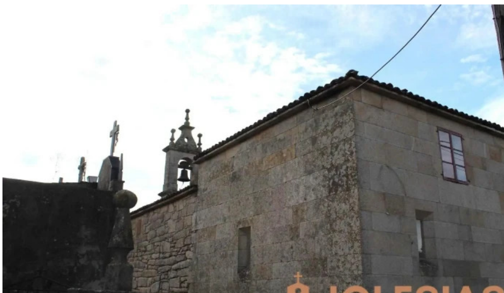
Iglesia de san martin de amarante iglesia