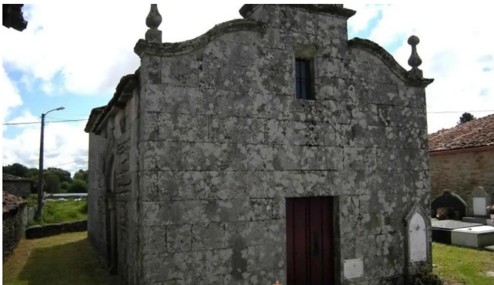
Iglesia de san martin de amarante antas de ulla