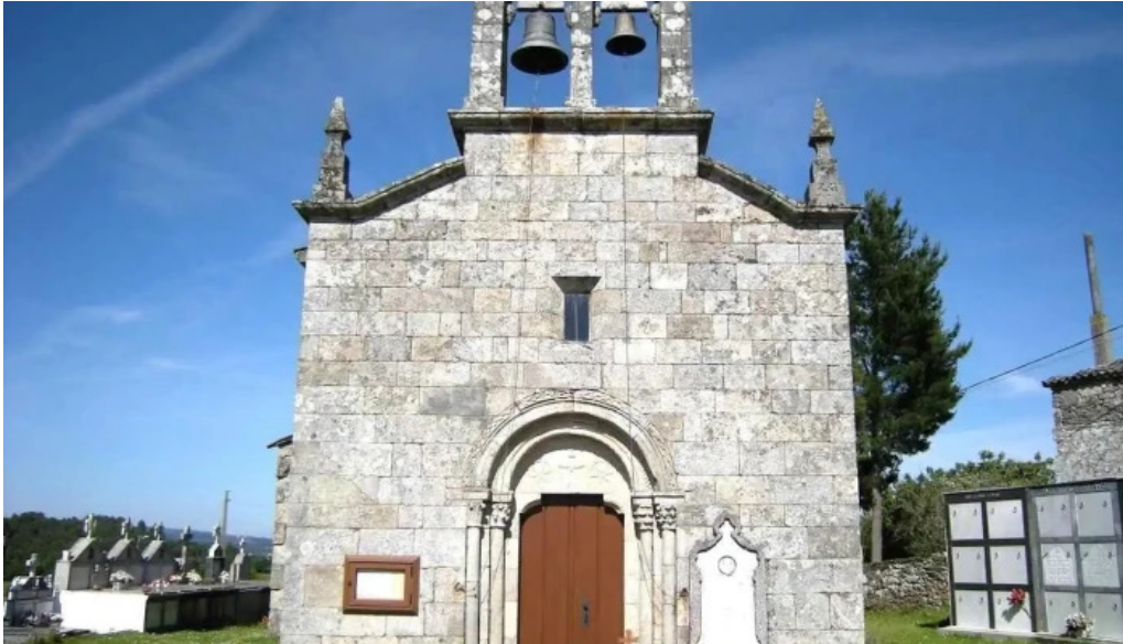
Iglesia de san lorenzo de peibas antes de ulla