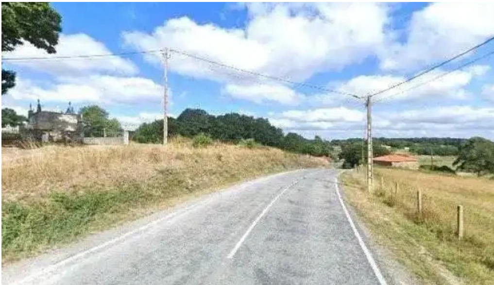
Iglesia de san lorenzo de peibas zona