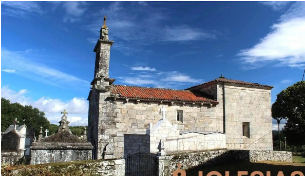
Iglesia de san lorenzo de peibas iglesia