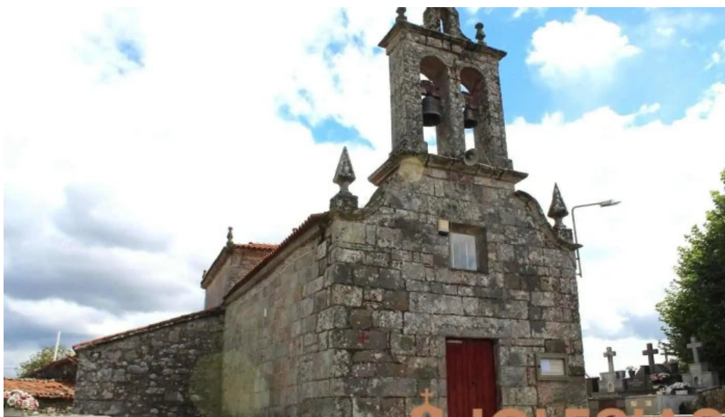
Iglesia de san jorge de terra cha antas de ulla