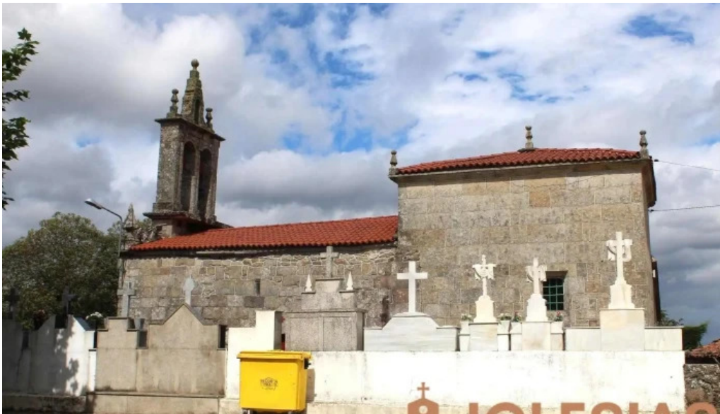
Iglesia de san jorge de terra cha iglesia