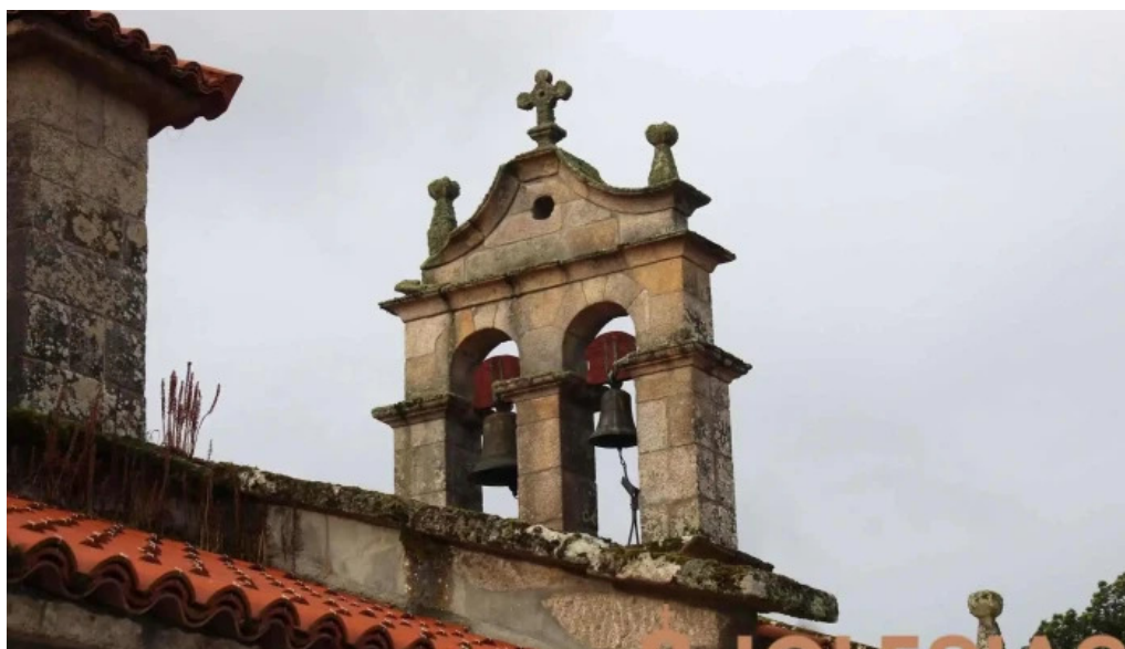
Iglesia de san esteban de castro de amarante iglesia