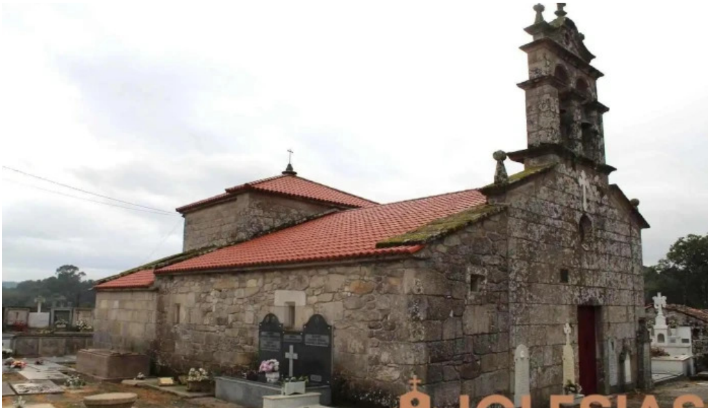
Iglesia de san esteban de castro de amarante antes de ulla