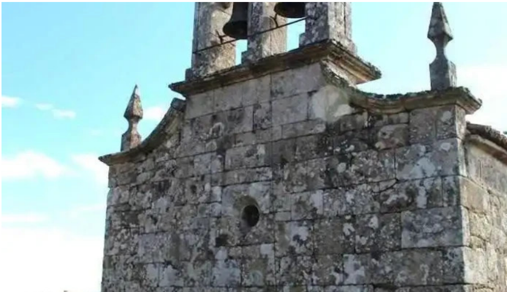
Iglesia de san andres de o rial antes de ulla