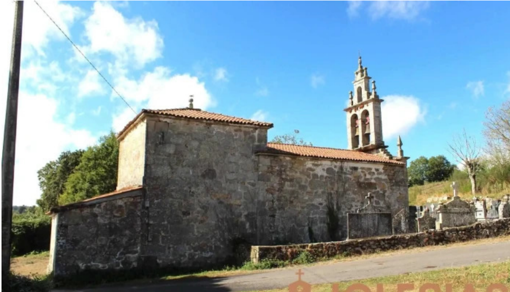
Iglesia de san andres de o rial iglesia