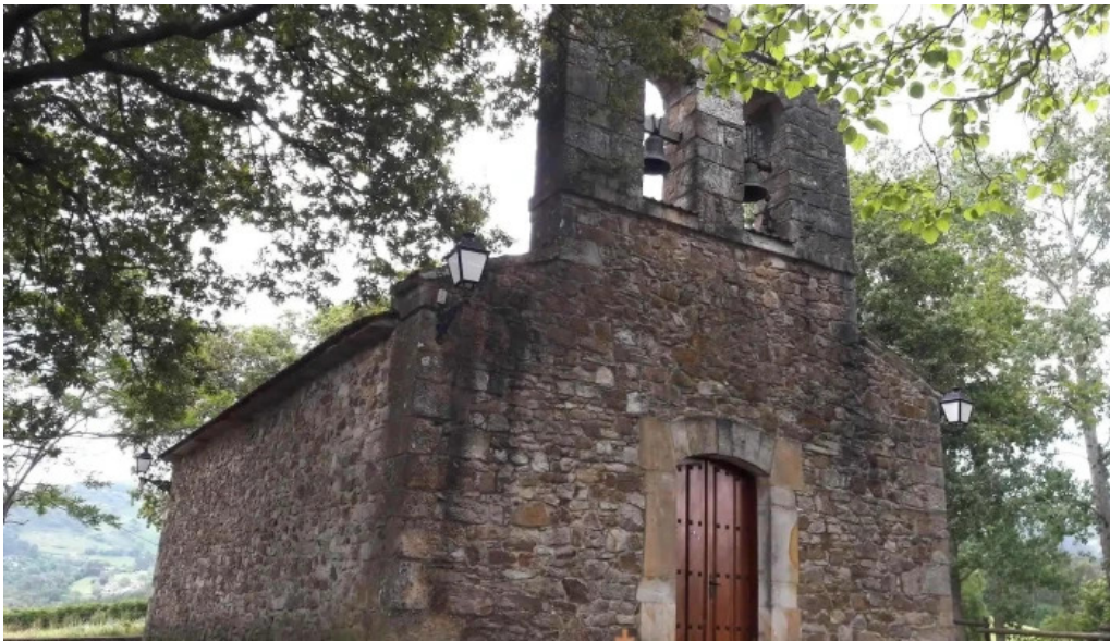
Ermita de san pedruco iglesia