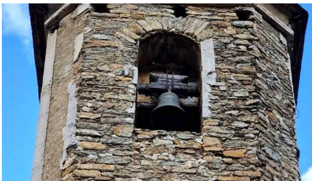
San serni de altron iglesia