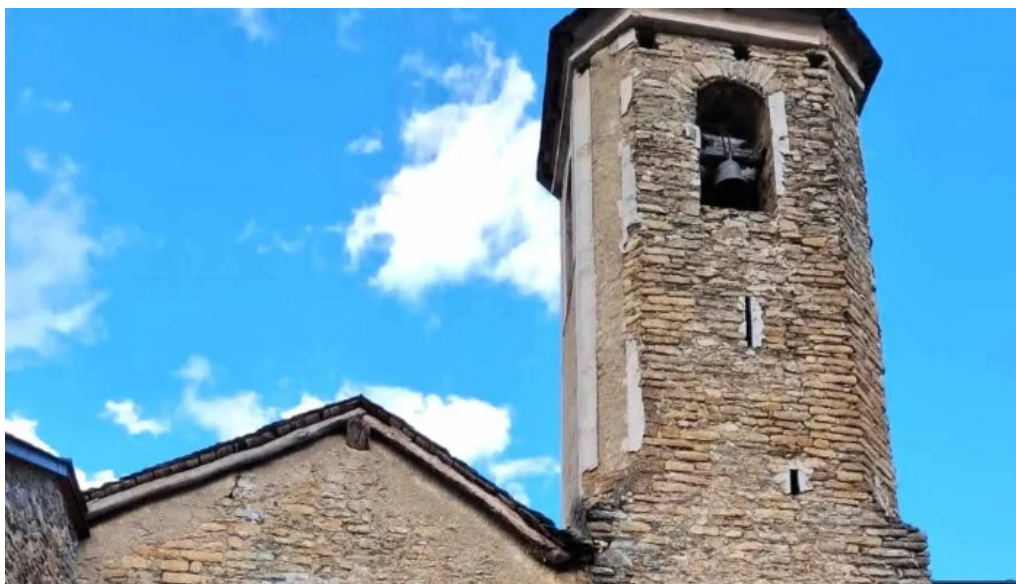
San serni de altron altron