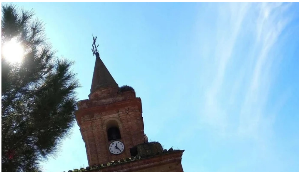
Iglesia de nuestra senora de gracia comentario 1