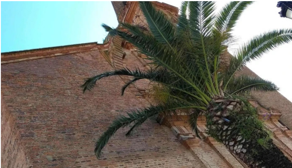
Iglesia de nuestra senora de gracia comentario 4