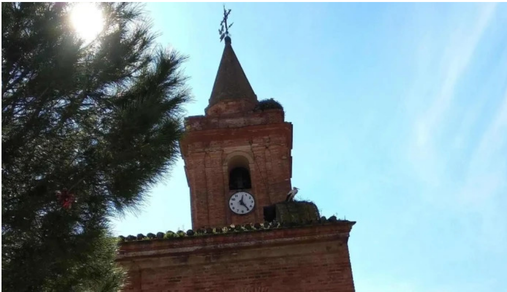
Iglesia de nuestra senora de gracia comentario 2