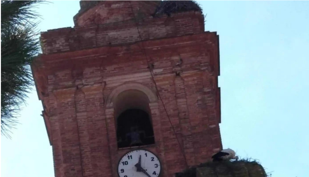
Iglesia de nuestra senora de gracia comentario 3