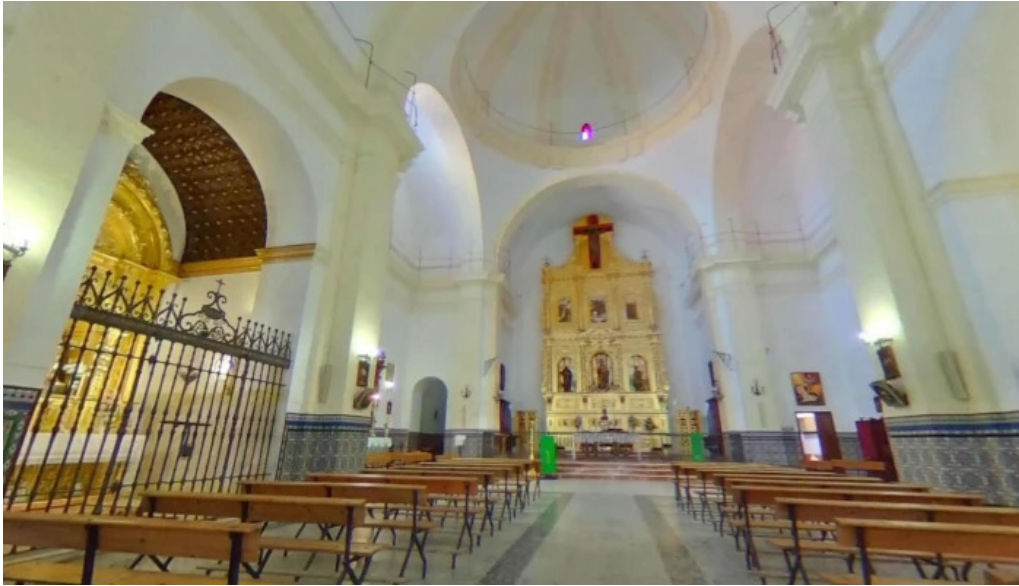
Iglesia de nuestra senora de gracia iglesia