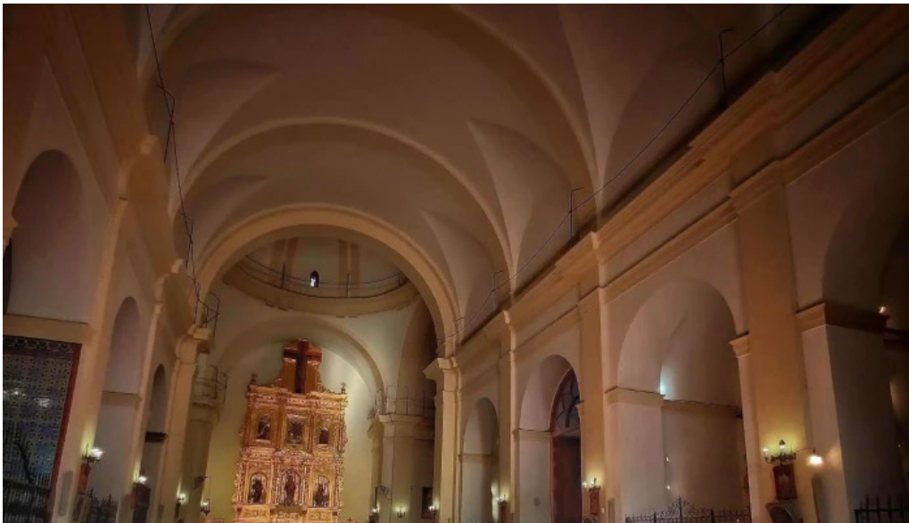
Iglesia de nuestra senora de gracia comentario 6