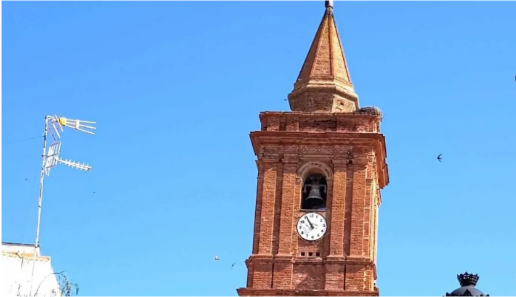
Iglesia de nuestra senora de gracia comentario 5