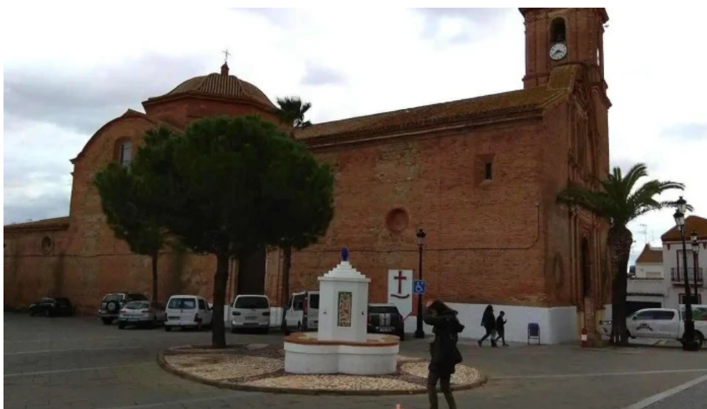
Iglesia de nuestra senora de gracia alosno