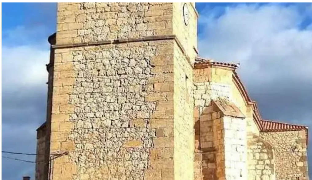
Iglesia de san pedro apostol almenar de soria