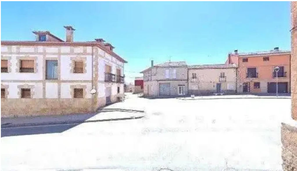
Iglesia de san pedro apostol como llegar