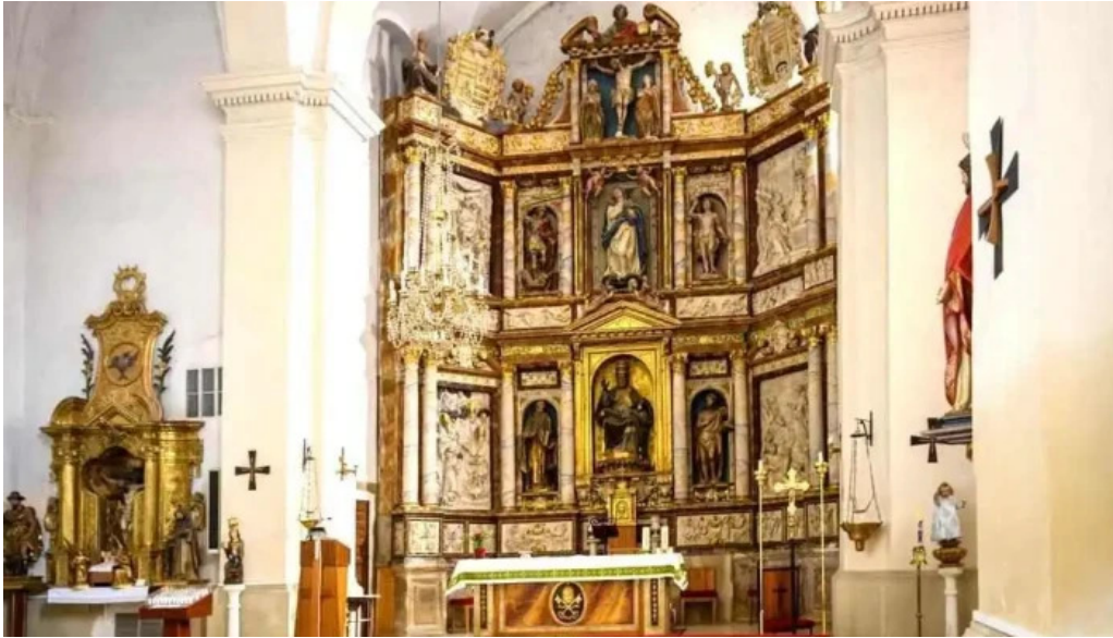
Iglesia de san pedro apostol iglesia