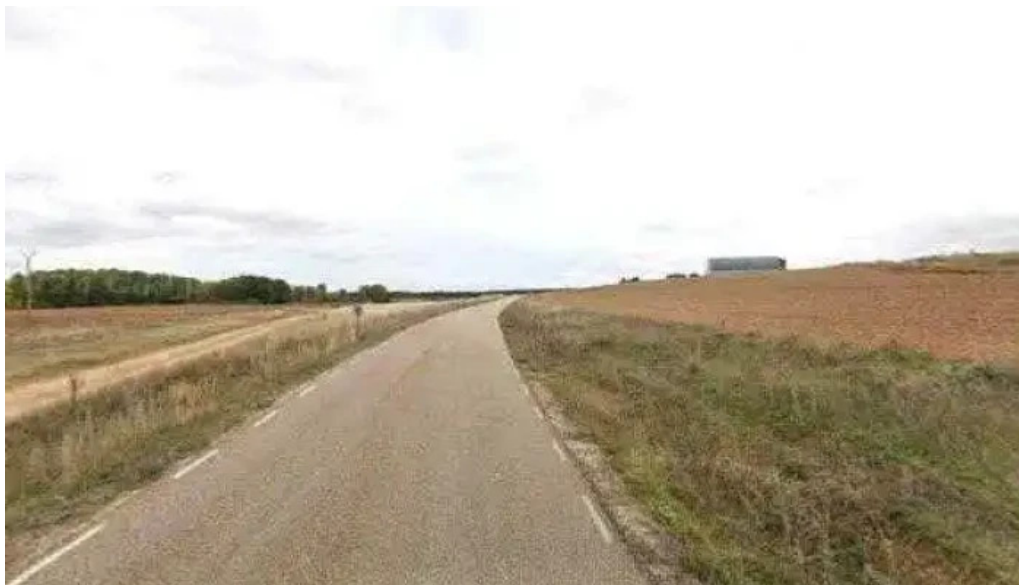
Ermita de san juan iglesia