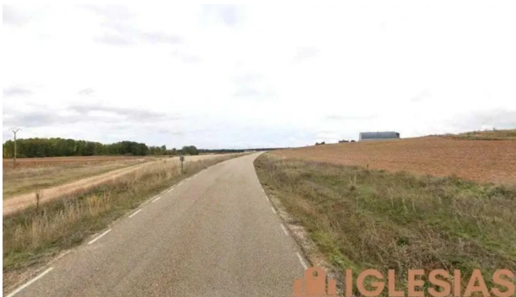
Ermita de san juan almarail