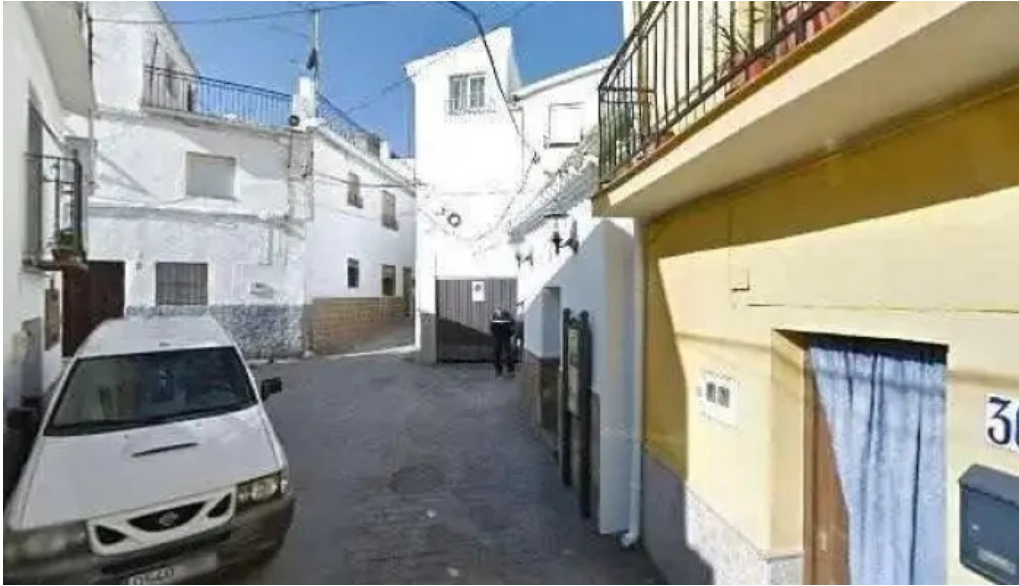
Ermita virgen de las angustias cerca de mi