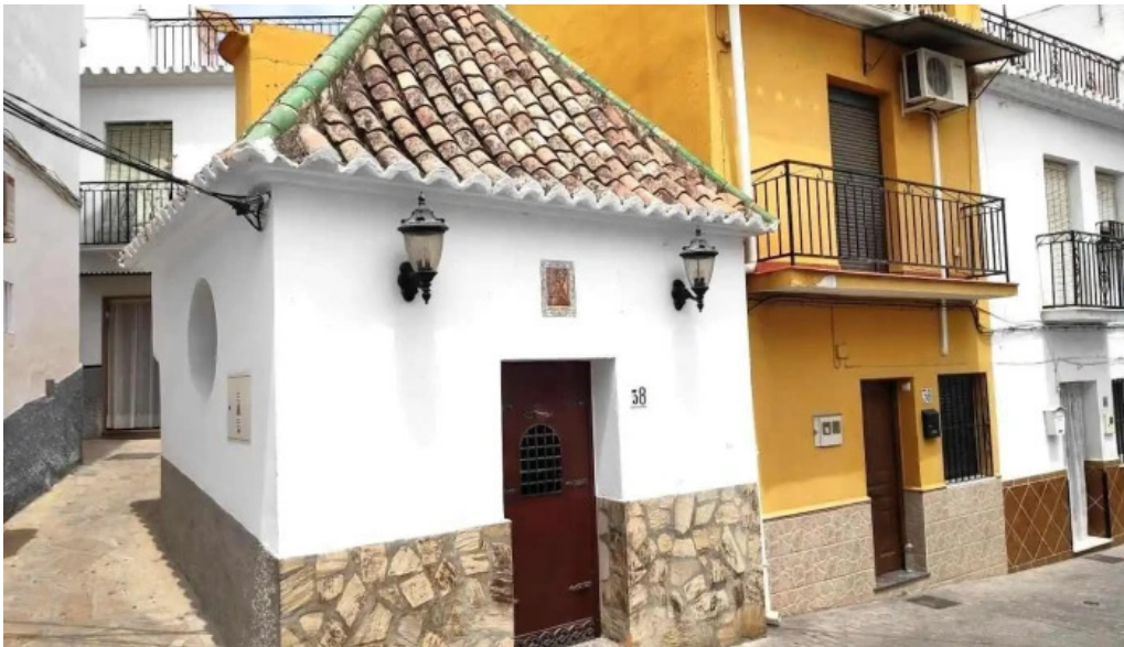
Ermita virgen de las angustias algarrobo