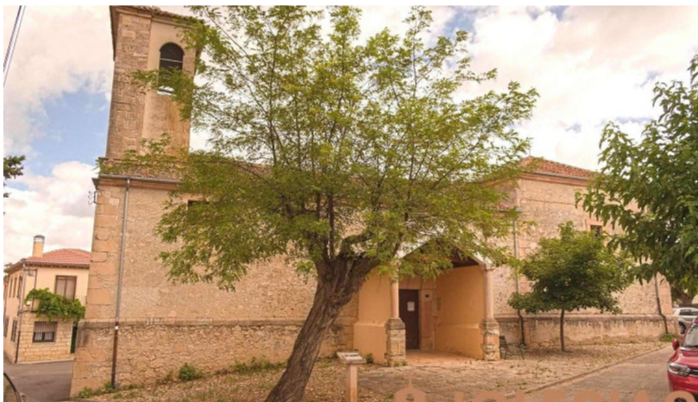
Iglesia san martin de tours aldealcorvo