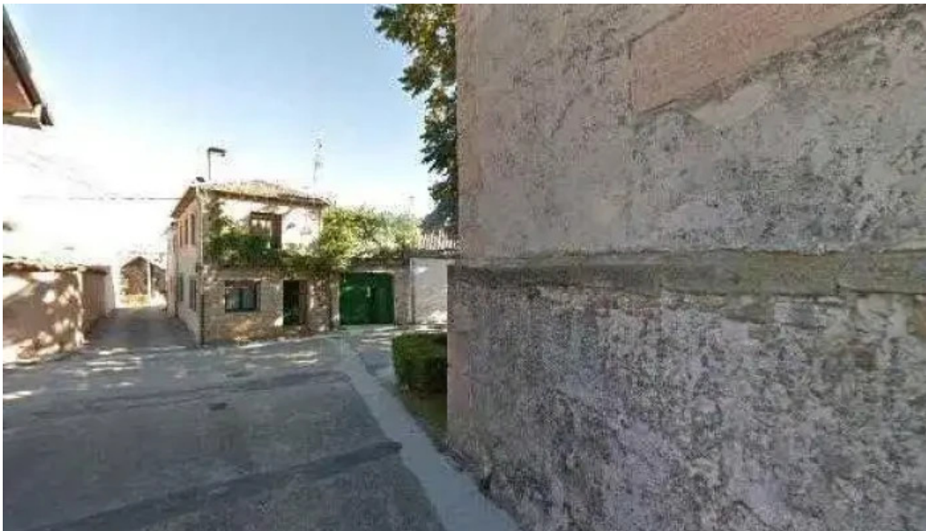
Iglesia san martin de tours cerca de mi