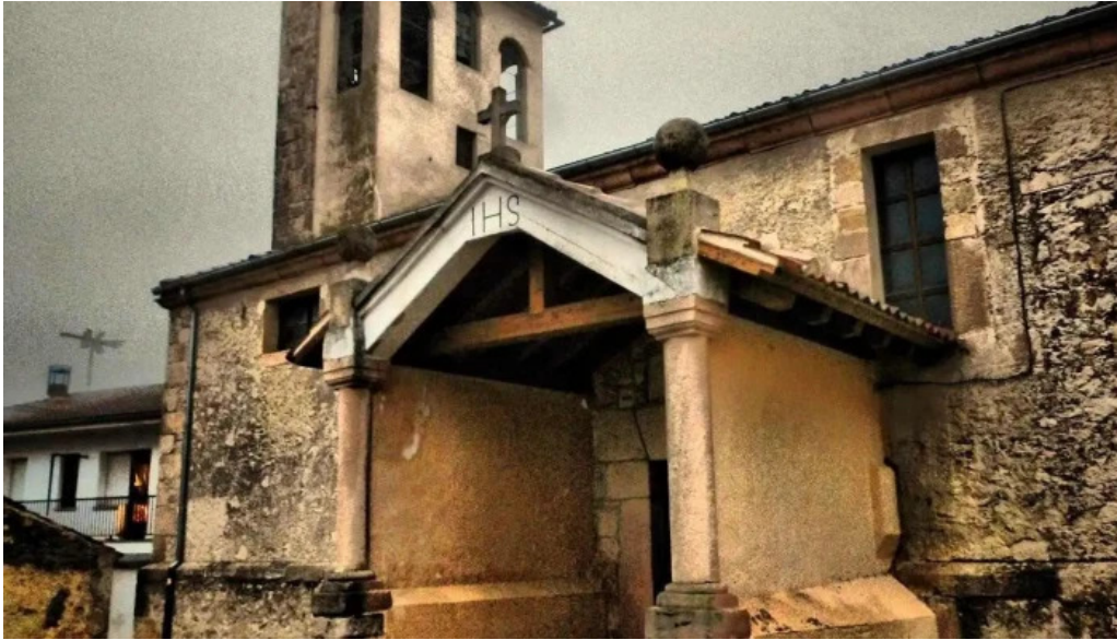
Iglesia san martin de tours iglesia