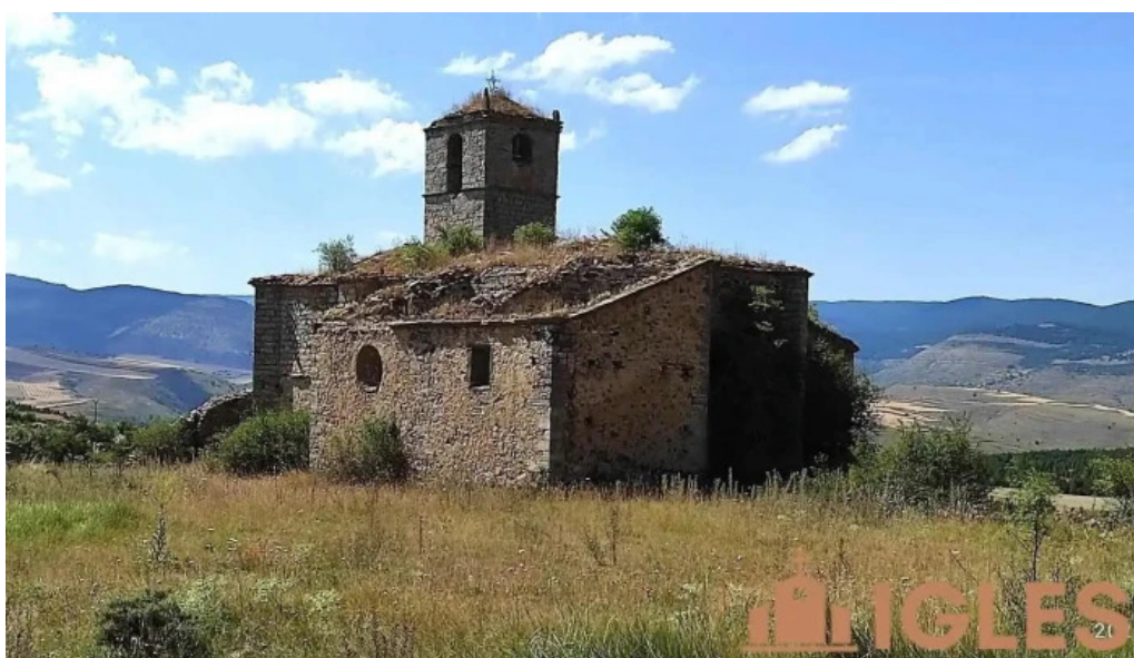
Iglesia de san clemente aldealcardo