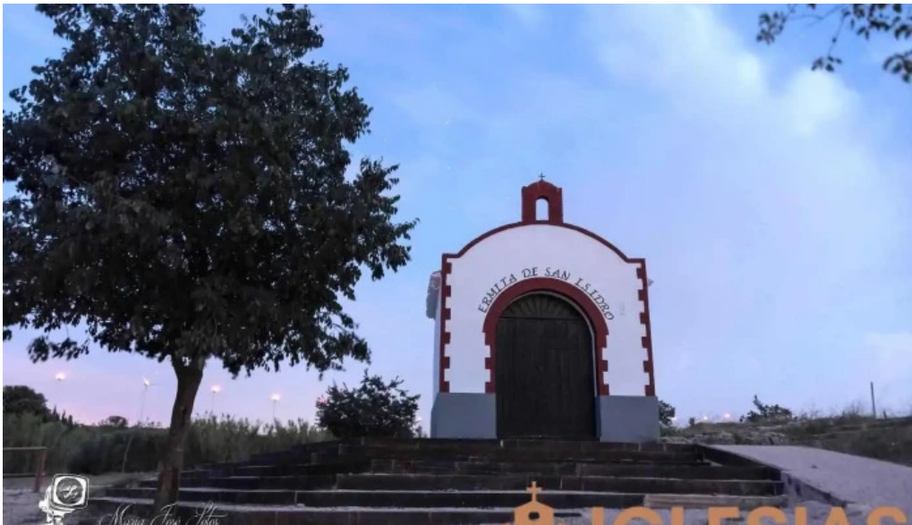
Ermita san isidro albacete