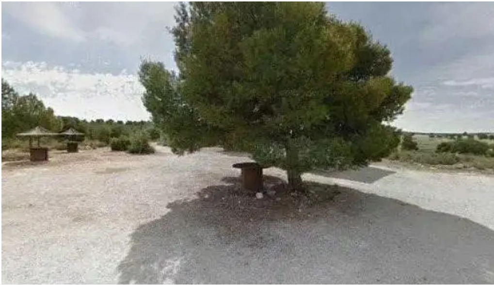
Ermita san isidro horario