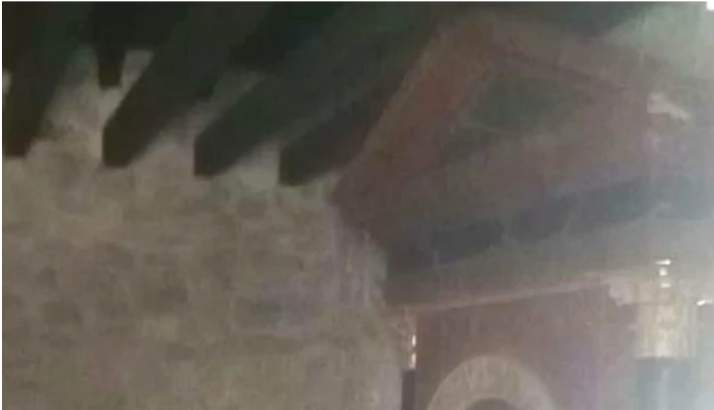
Nuestra senora del lago alava