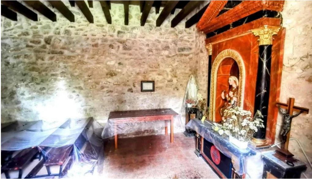
Nuestra senora del lago iglesia