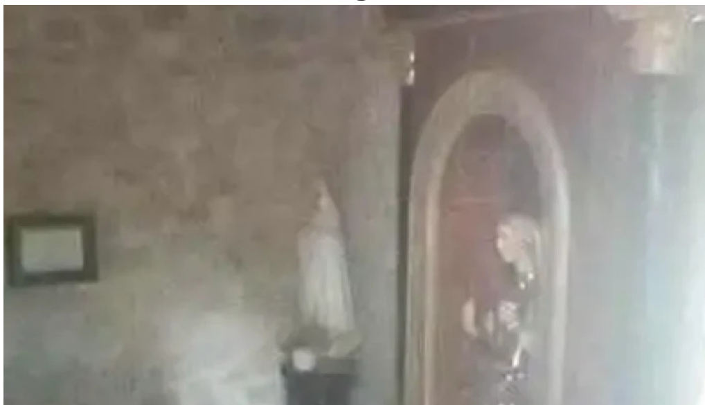
Nuestra senora del lago videos