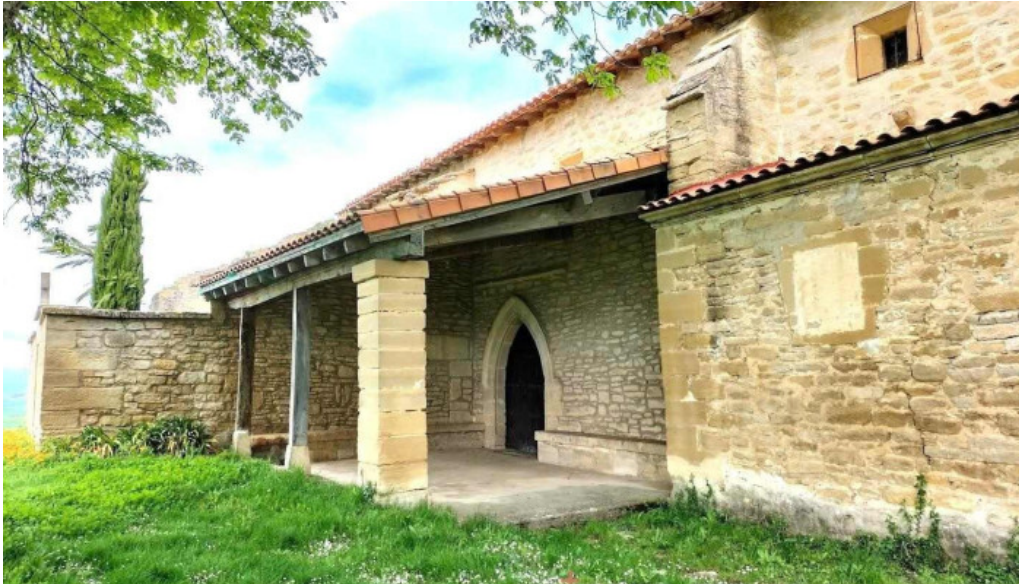
Iglesia de san clemente alava