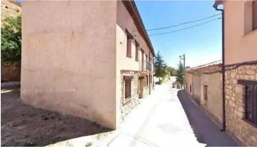
Iglesia de santa cristina precios