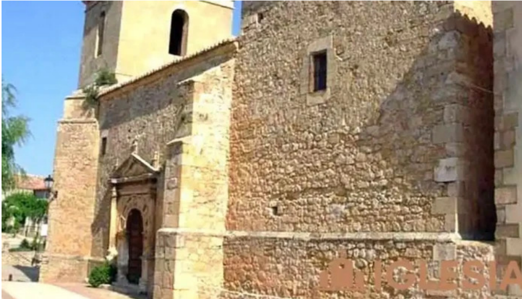
Iglesia de santa cristina iglesia