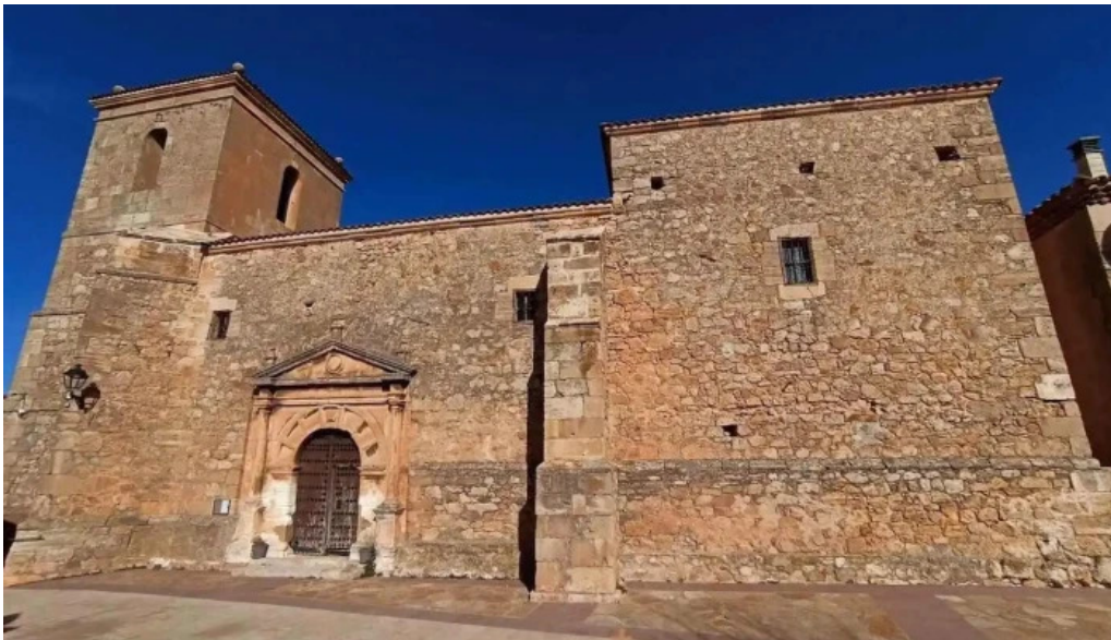
Iglesia de santa cristina adobes