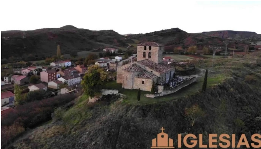
Iglesia de santa maria la mayor videos