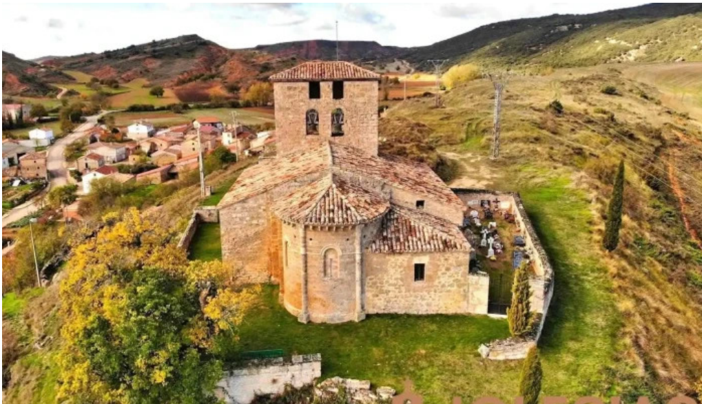
Iglesia de santa maria la mayor abajas