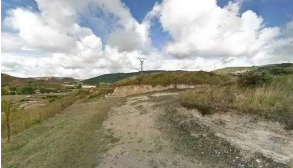
Iglesia de santa maria la mayor comentarios