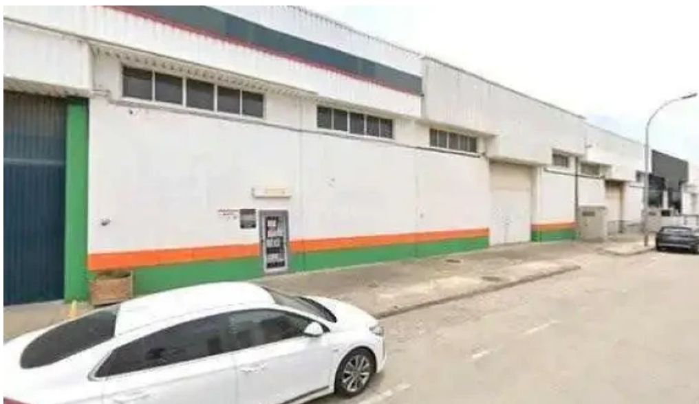
Iglesia pentecostal unida de espana en huesca pentecostal