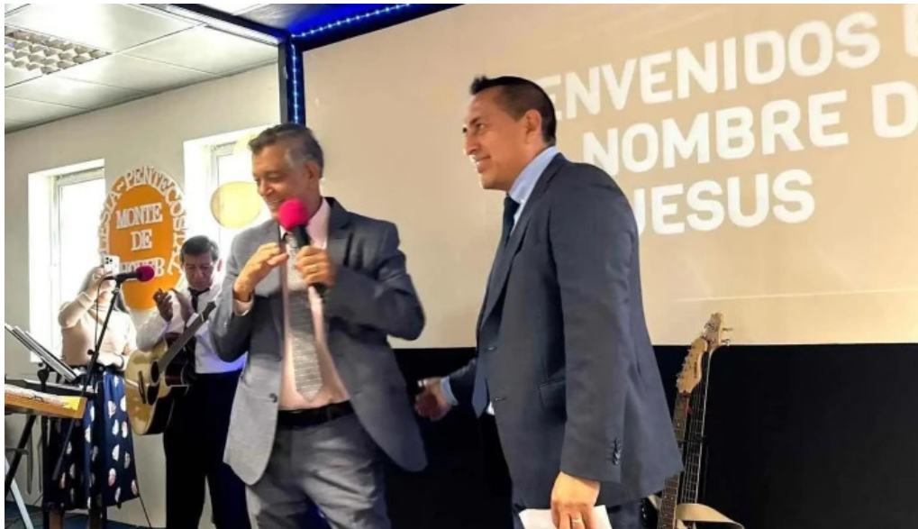
Iglesia pentecostal unida de espana en huesca iglesia