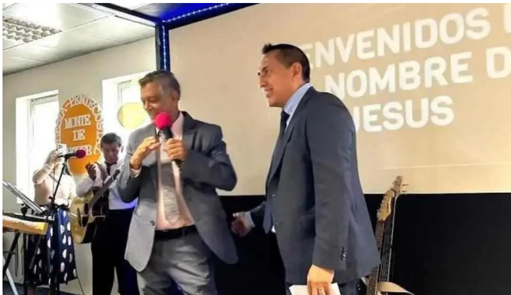
Iglesia pentecostal unida de espana en huesca huesca