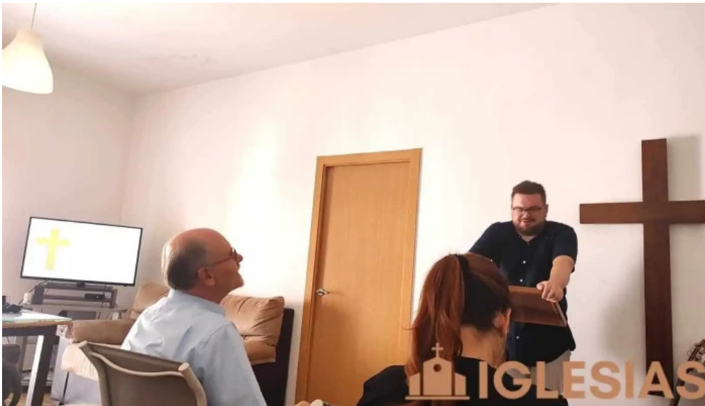
Iglesia evangelica presbiteriana los santos de maimona