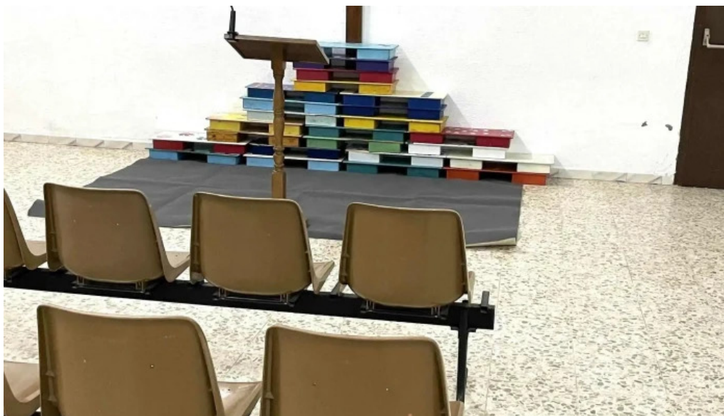
Iglesia evangelica presbiteriana del propietario