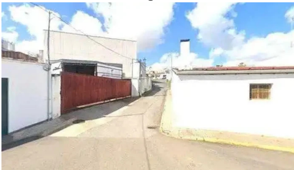
Iglesia evangelica presbiteriana sitio web