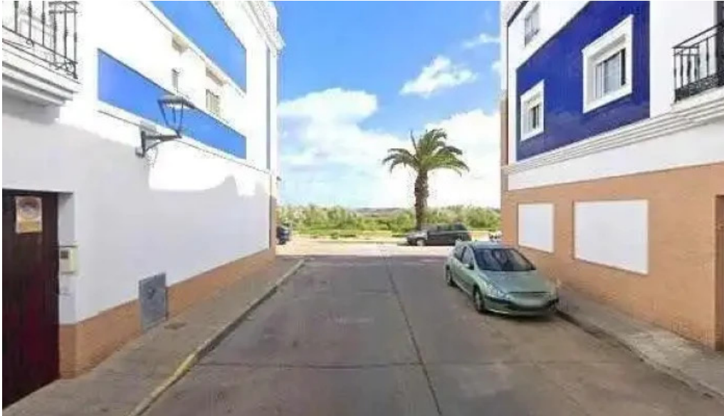
Iglesia evangelica betania iglesia evangelica