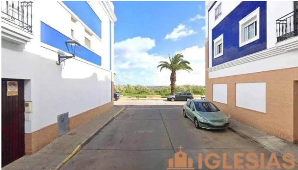
Iglesia evangelica betania isla cristina