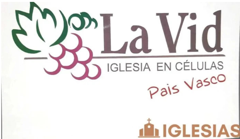
Iglesia la vid gernika del propietario