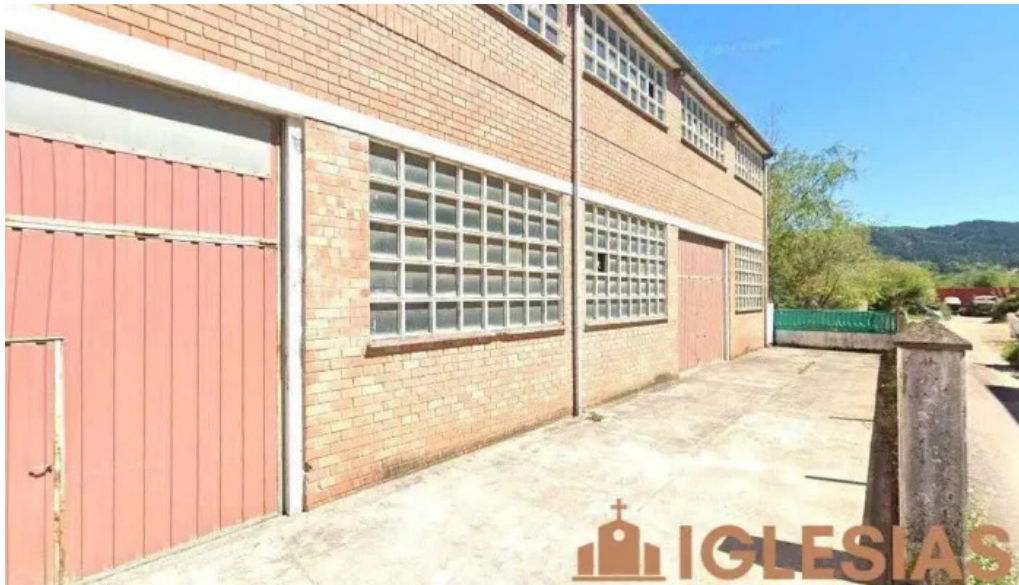
Iglesia la vid gernika guernica