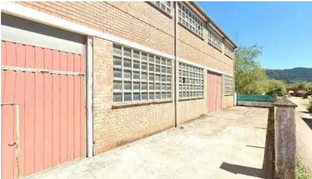
Iglesia la vid gernika iglesia evangelica