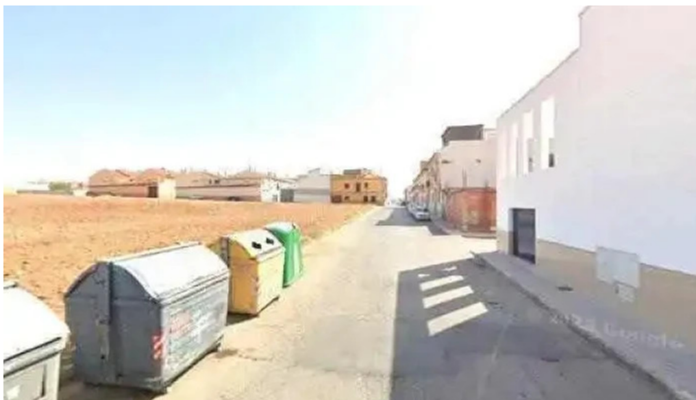
Salon del reino de los testigos cristianos de jehova iglesia