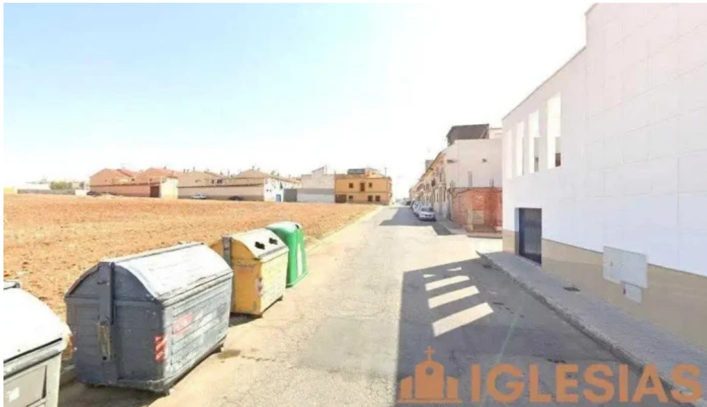
Salon del reino de los testigos cristianos de jehova puente genil