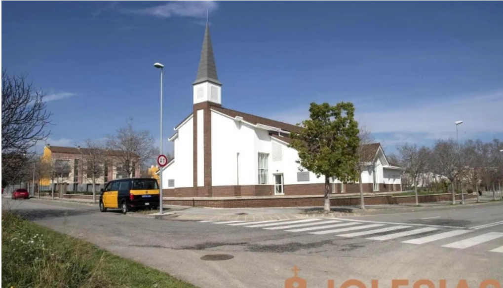
La iglesia de Jesucristo de los Santos de los Últimos Días Iglesia Cristiana