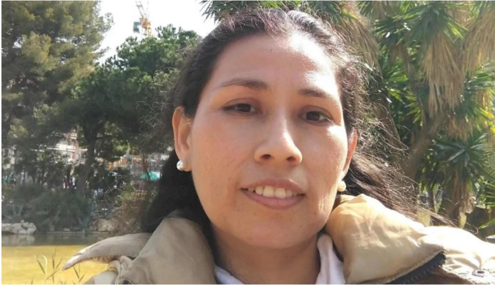
La iglesia de jesucristo de los santos de los ultimos dias vilafranca del penedes