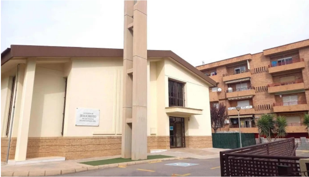
Iglesia de jesucristo de los santos de los ultimos dias cartagena iglesia cristiana