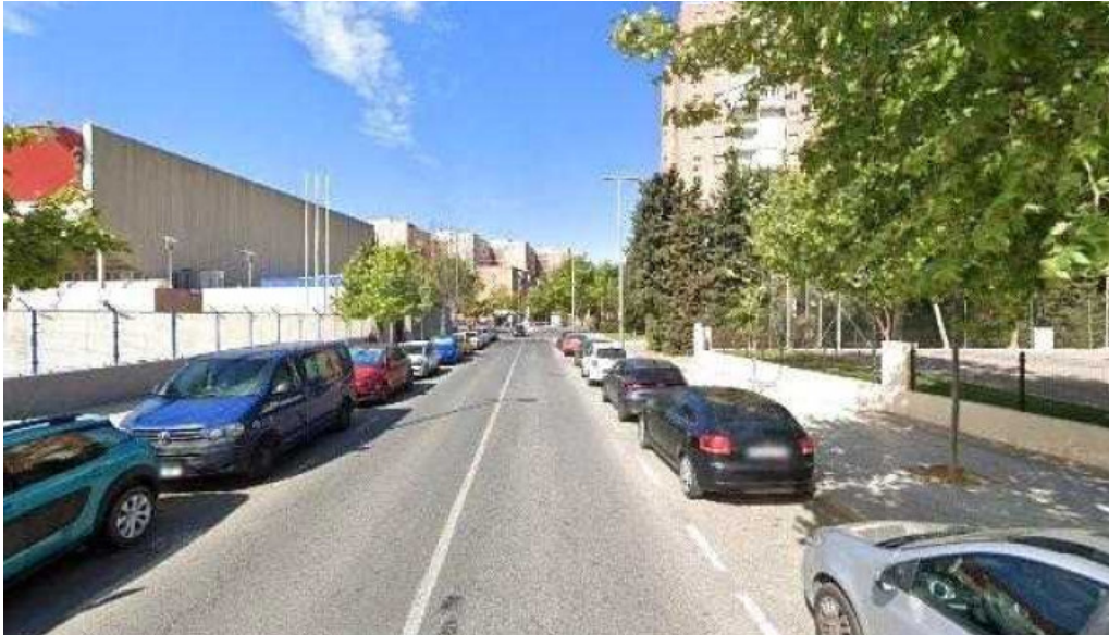
Iglesia de jesucristo de los santos de los ultimos dias cartagena sitio web