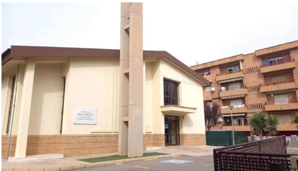
Iglesia de jesucristo de los santos de los ultimos días cartagena cartagena