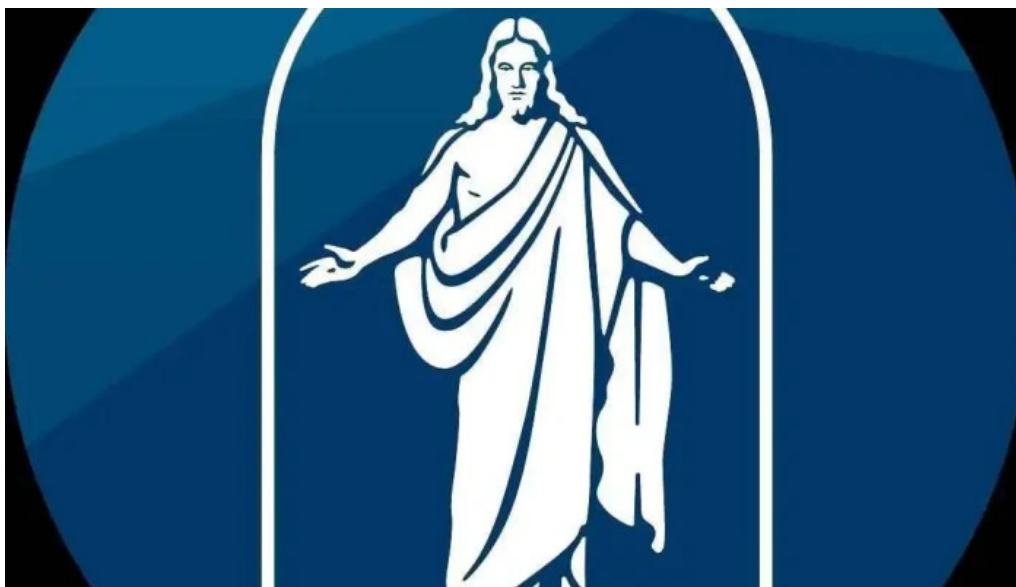
La iglesia de jesucristo de los santos de los ultimos dias del propietario