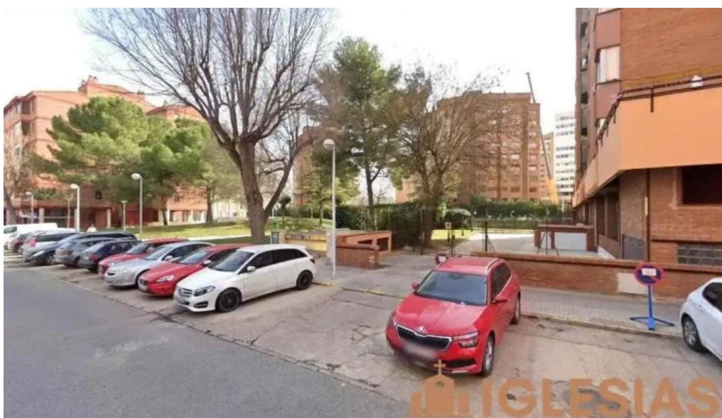
La iglesia de jesucristo de los santos de los ultimos dias albacete