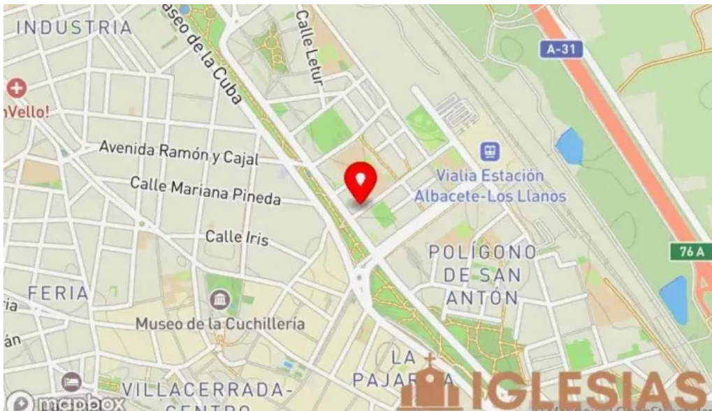
La iglesia de jesucristo de los santos de los ultimos dias mapa