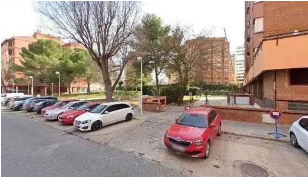
La iglesia de jesucristo de los santos de los ultimos dias iglesia cristiana