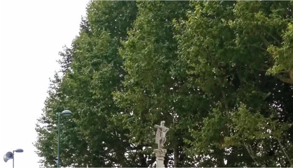
Iglesia de san mamede de torroso zona