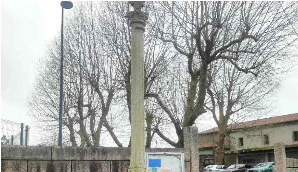
Iglesia de san mamede de torroso puntaje