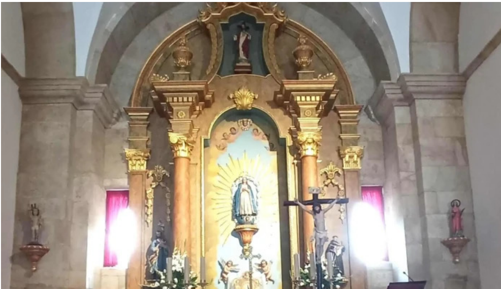
Iglesia de san mamede de torroso xarandela