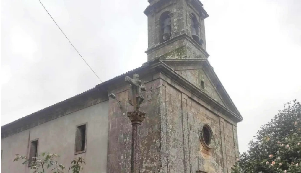
Iglesia de san mamede de torroso como llegar