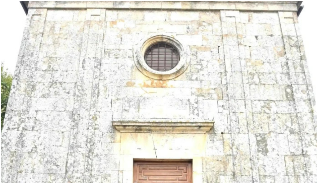
Iglesia de san mamede de torroso viejos