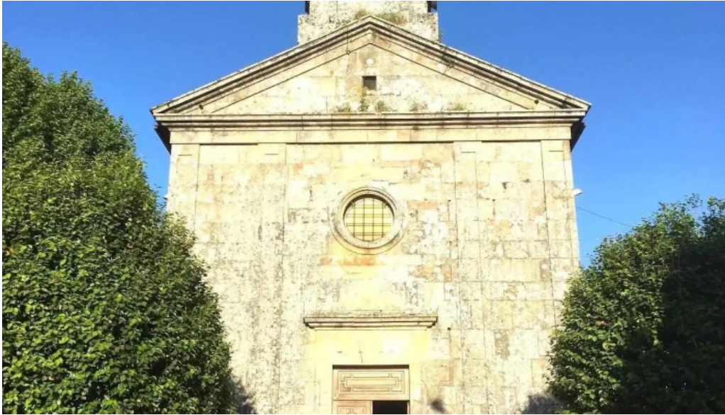
Iglesia de san mamede de torroso iglesia catolica