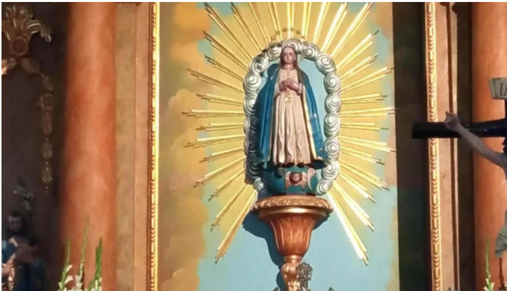
Iglesia de san mamede de torroso numero