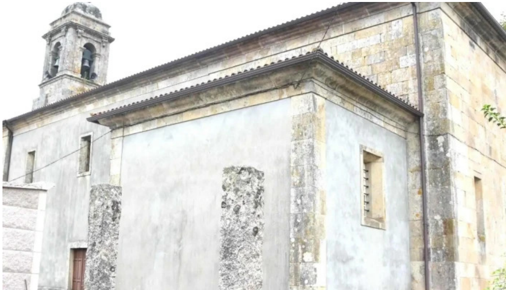
Iglesia de san mamede de torroso catalogo