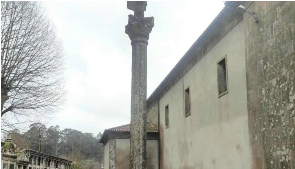
Iglesia de san mamede de torroso comentarios