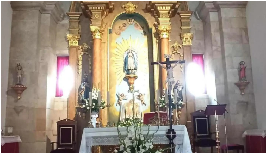
Iglesia de san mamede de torroso iglesia