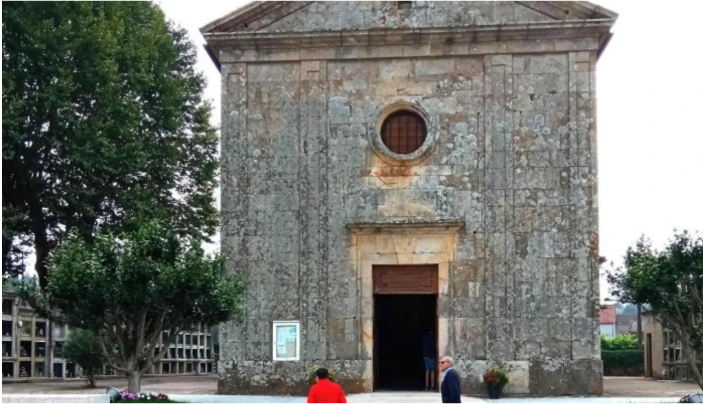
Iglesia de san mamede de torroso direccion