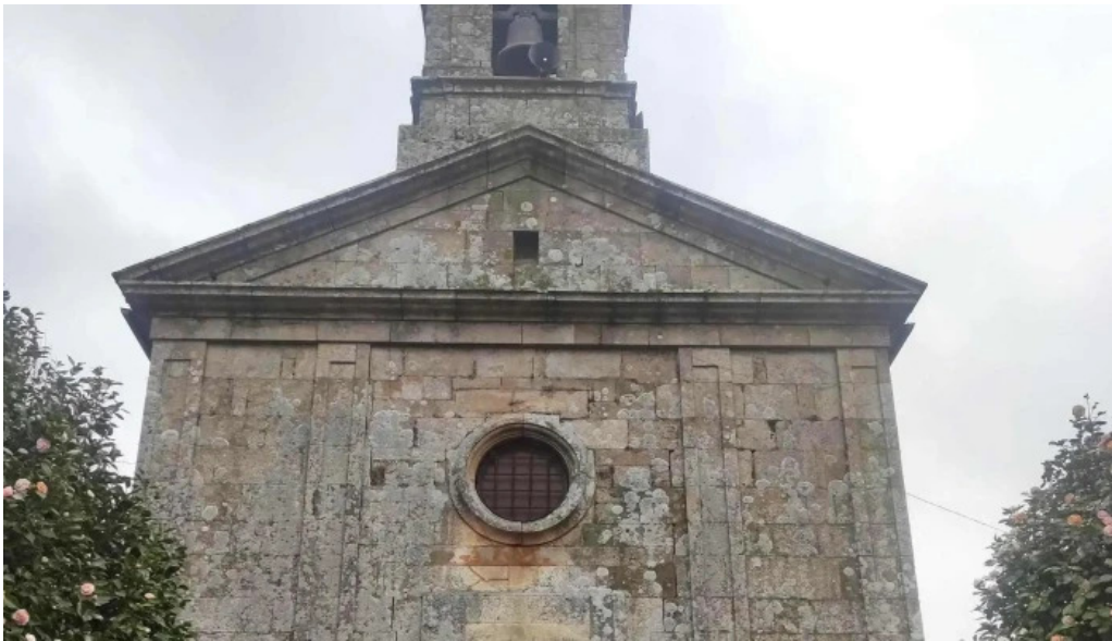
Iglesia de san mamede de torroso donde