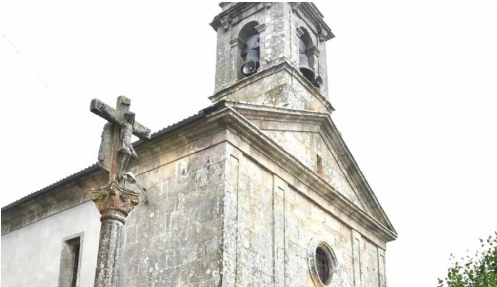
Iglesia de san mamede de torroso descuentos