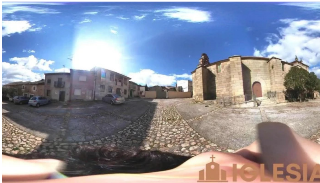
Iglesia de nuestra senora de la asuncion vilvestre