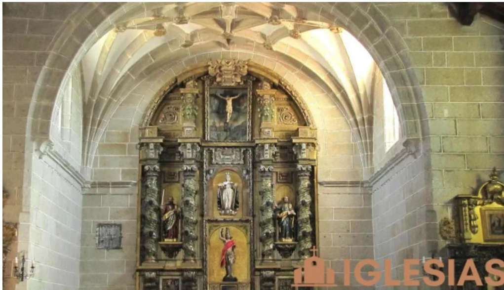
Iglesia de nuestra senora de la asuncion iglesia