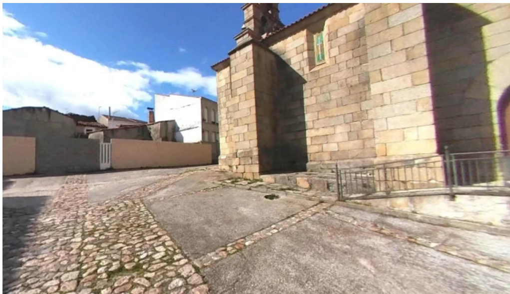
Iglesia de nuestra senora de la asuncion iglesia catolica