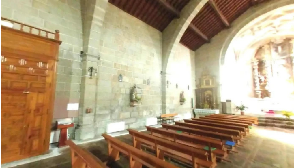
Iglesia de nuestra senora de la asuncion abierto ahora