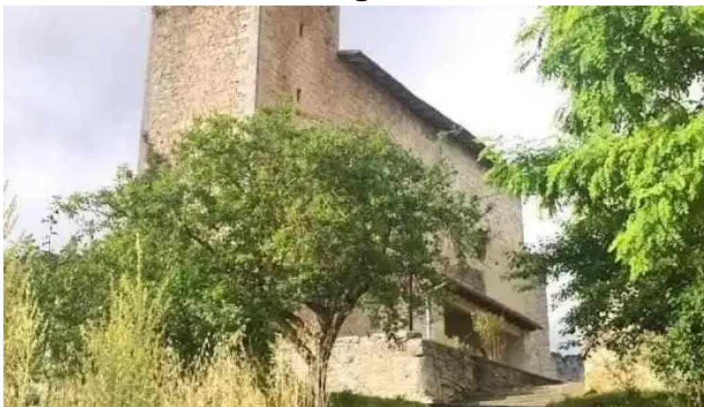
Iglesia de san andres viloria