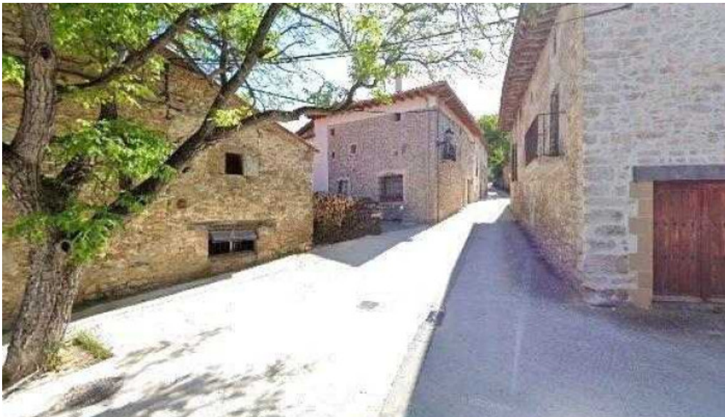
Iglesia de san andres direccion