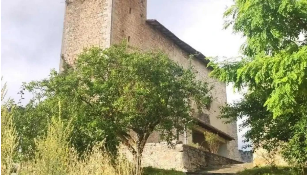
Iglesia de san andres iglesia catolica