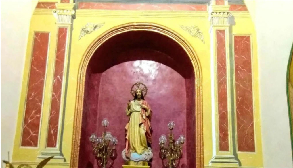
Iglesia de santa maria comentario 4