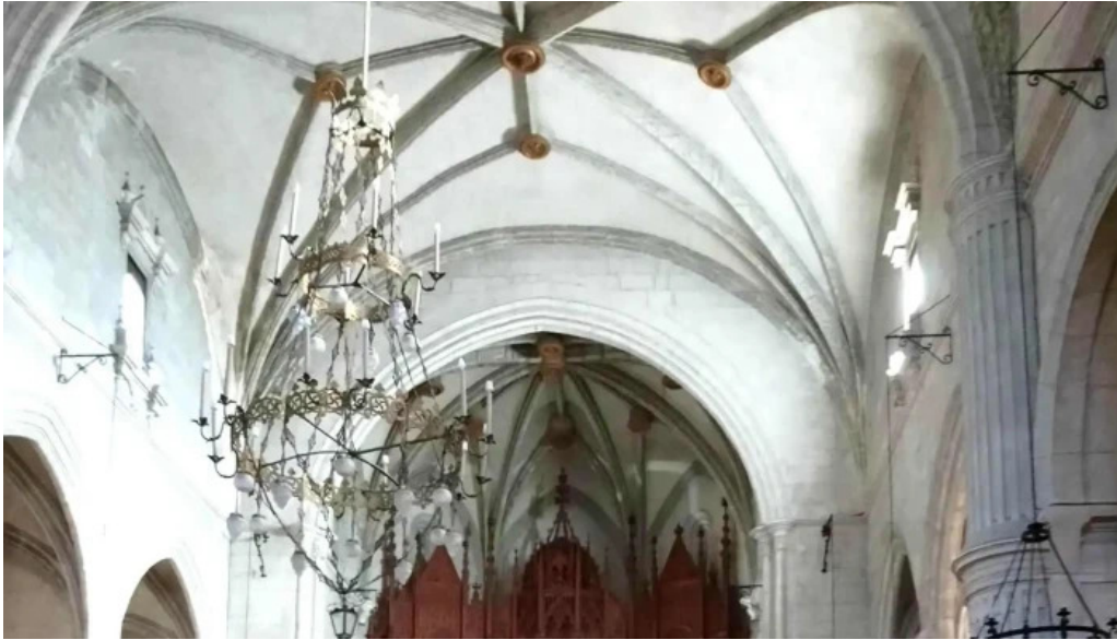
Iglesia de santa maria comentario 12