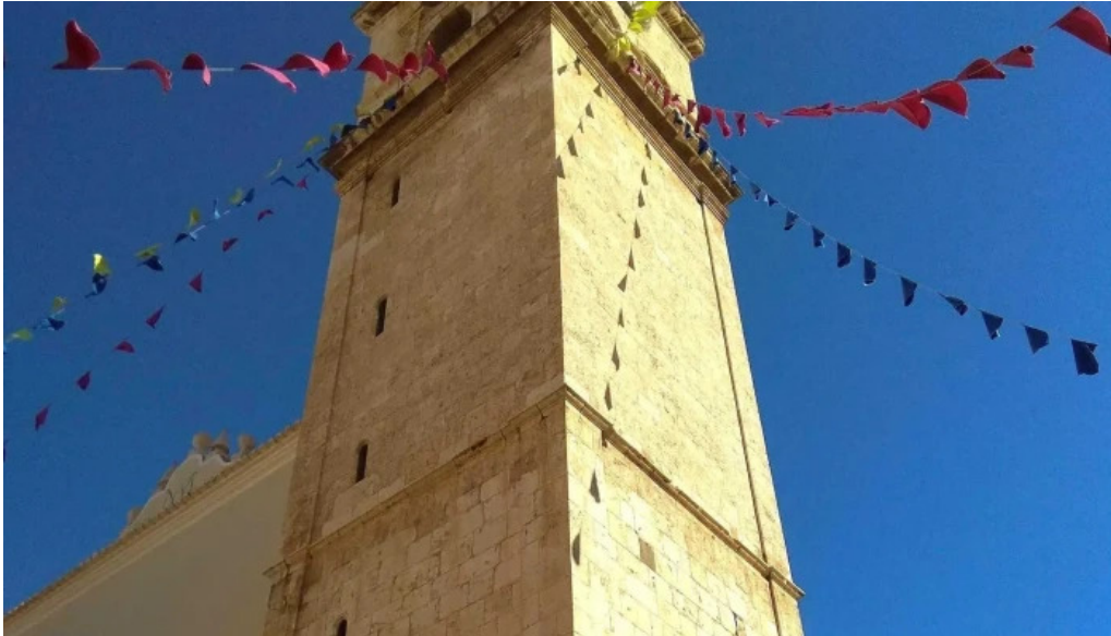
Iglesia de santa maria comentario 2