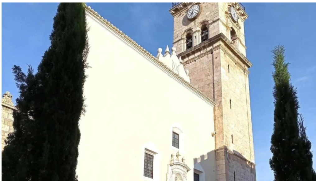
Iglesia de santa maria comentario 10