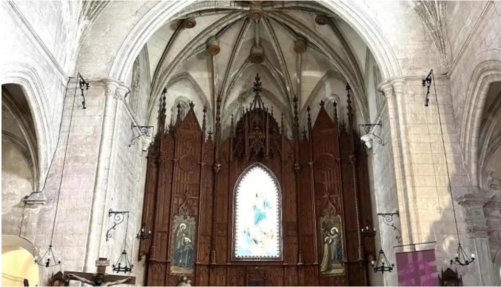
Iglesia de santa maria iglesia