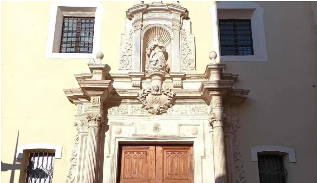
Iglesia de santa maria comentario 9