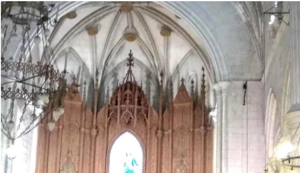
Iglesia de santa maria comentario 3