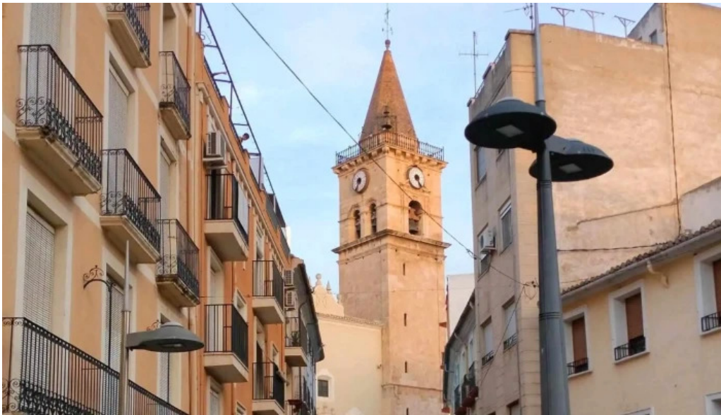
Iglesia de santa maria comentario 7