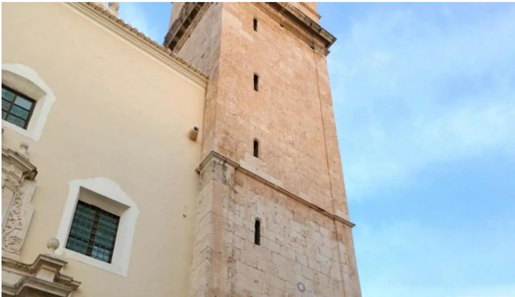
Iglesia de santa maria comentario 5