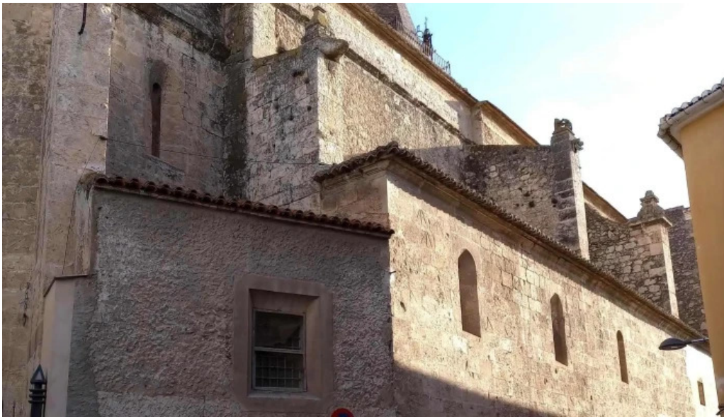
Iglesia de santa maria comentario 11