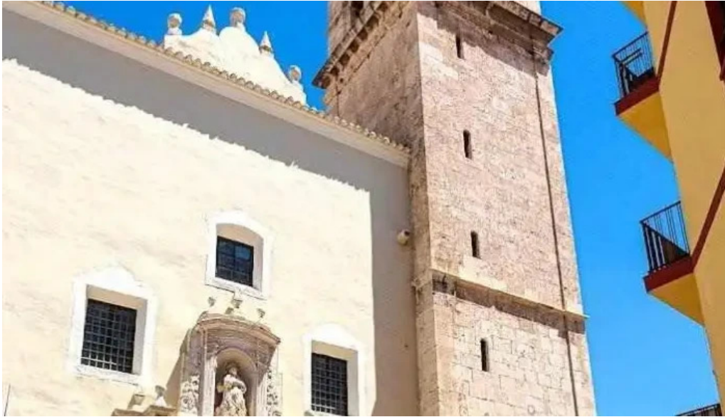
Iglesia de santa maria villena