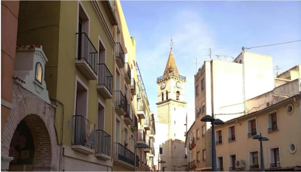
Iglesia de santa maria comentario 8