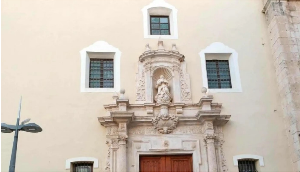
Iglesia de santa maria comentario 6