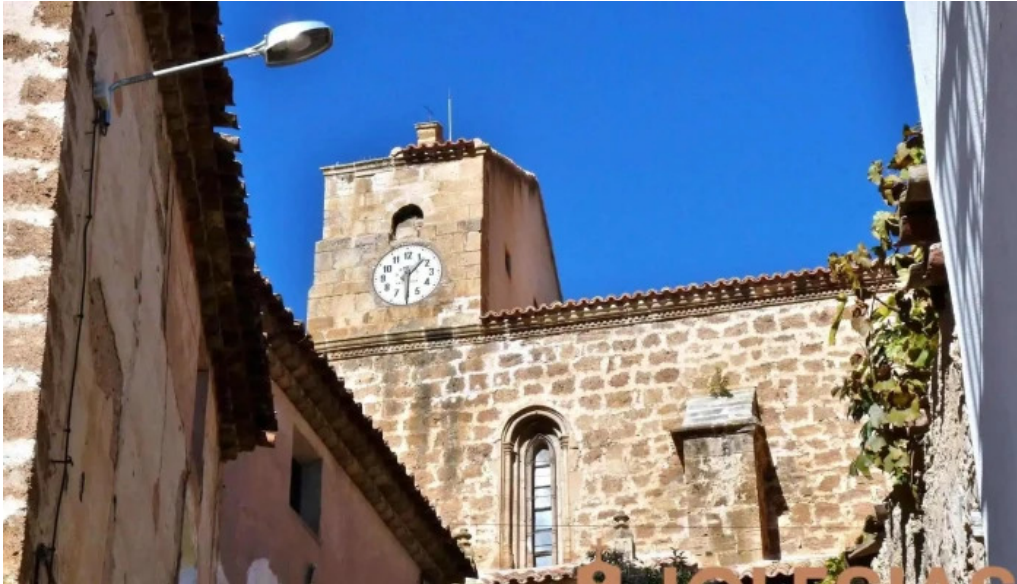
Iglesia de nuestra senora de la asuncion iglesia catolica