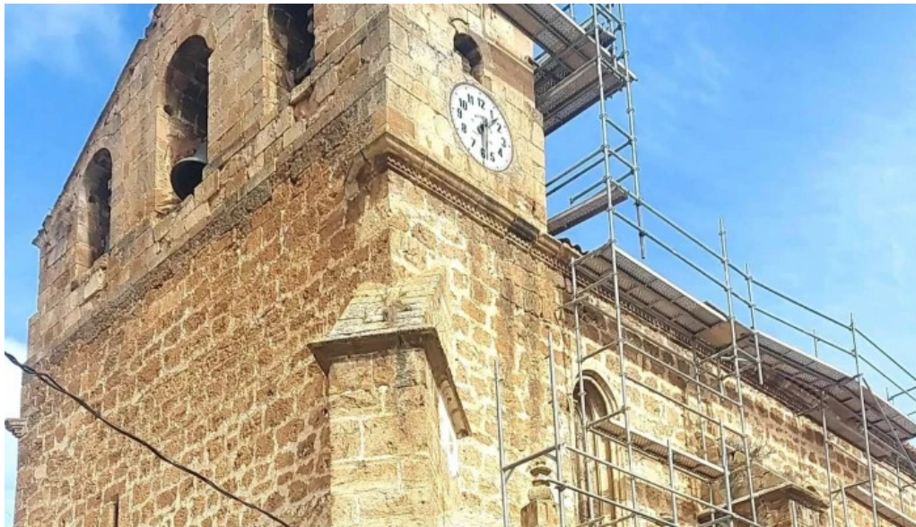
Iglesia de nuestra senora de la asuncion villet de mesa