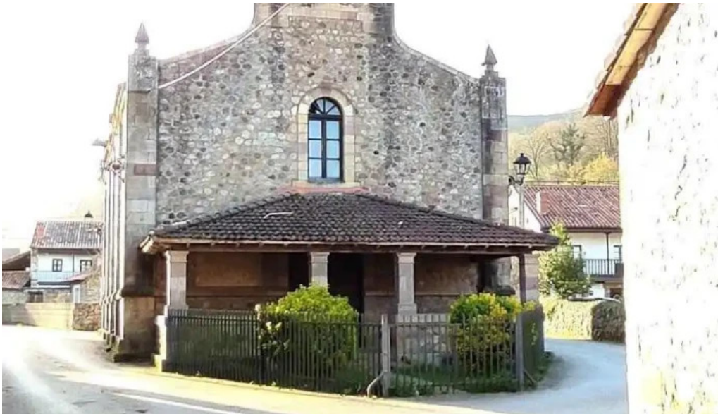
Iglesia de san sebastian iglesia catolica