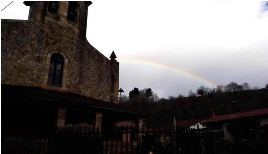
Iglesia de san sebastian iglesia