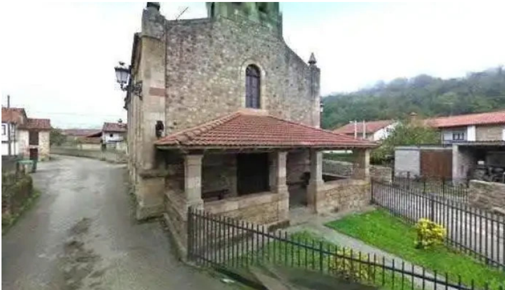
Iglesia de san sebastian comentarios