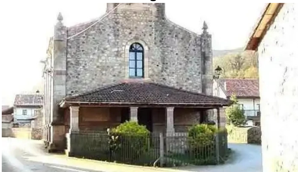
Iglesia de san sebastian villasuso de cieza