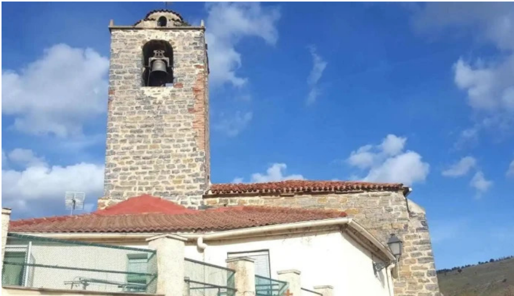
Iglesia de villar del rio villar del rio