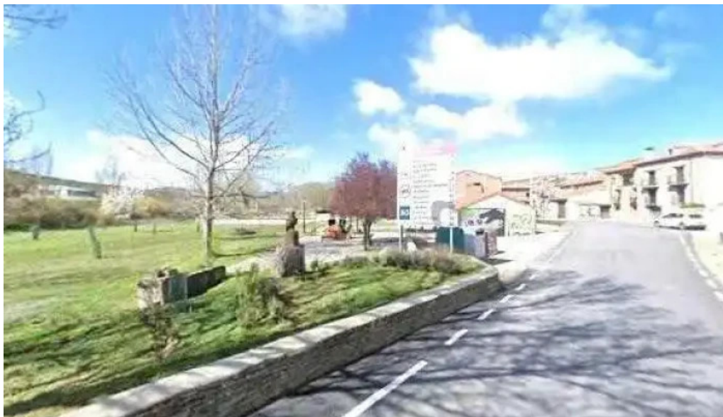
Iglesia de villar del rio instagram