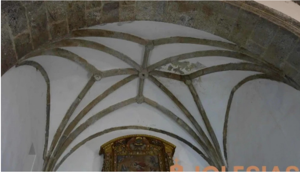
Iglesia de villar del rio iglesia