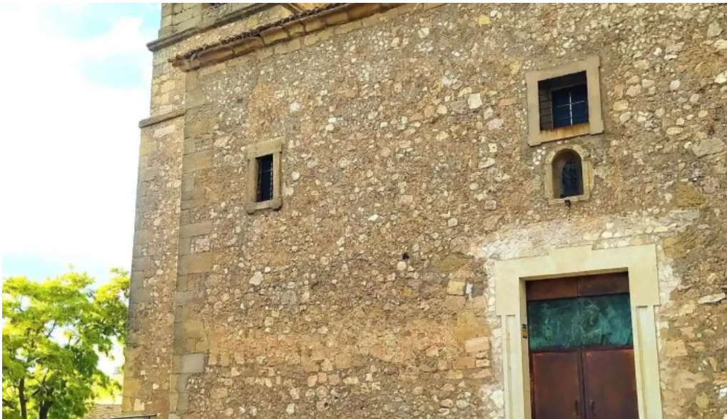
Iglesia de nuestra senora de la natividad iglesia