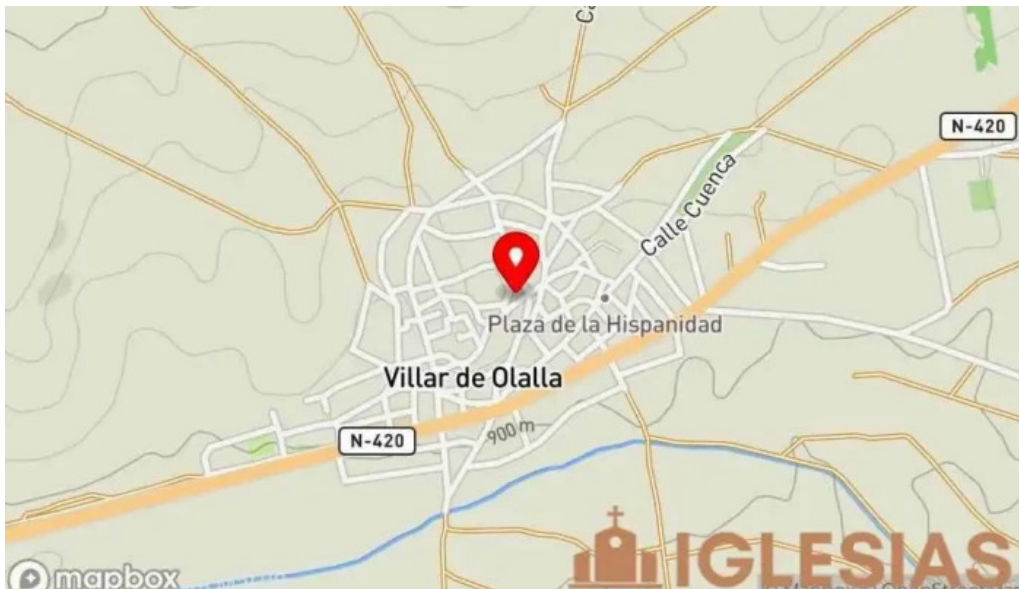
Iglesia de nuestra senora de la natividad mapa