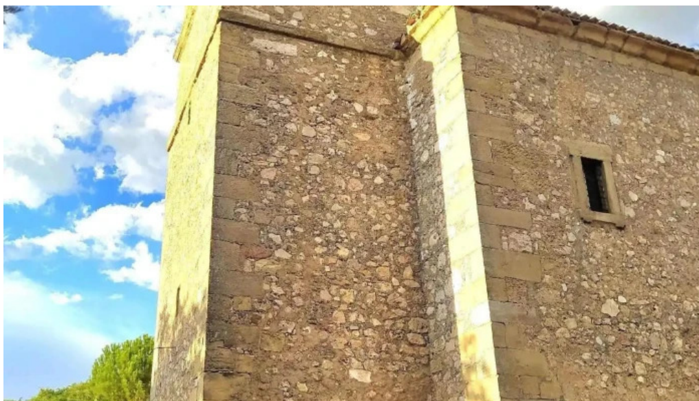
Iglesia de nuestra senora de la natividad iglesia catolica