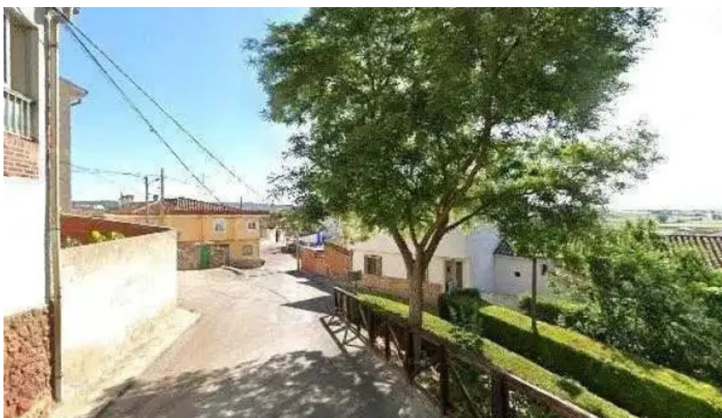
Iglesia de nuestra señora de la natividad promocion