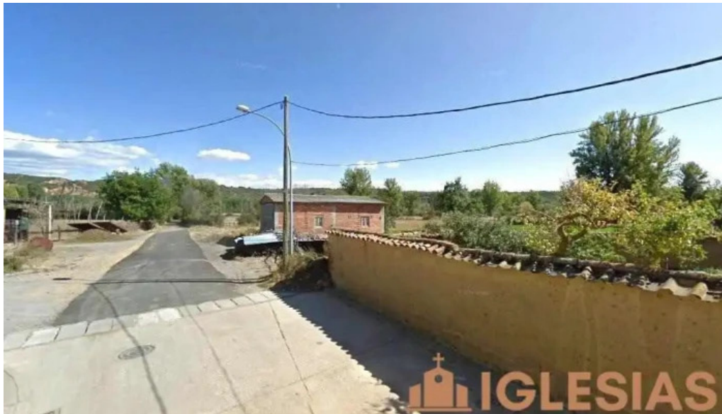
Iglesia de villarrodrigo de las regueras villaquilambre