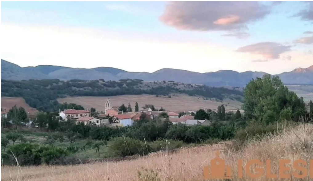
Iglesia de santiago apostol iglesia catolica