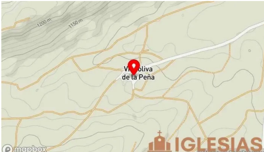
Iglesia de santiago apostol mapa