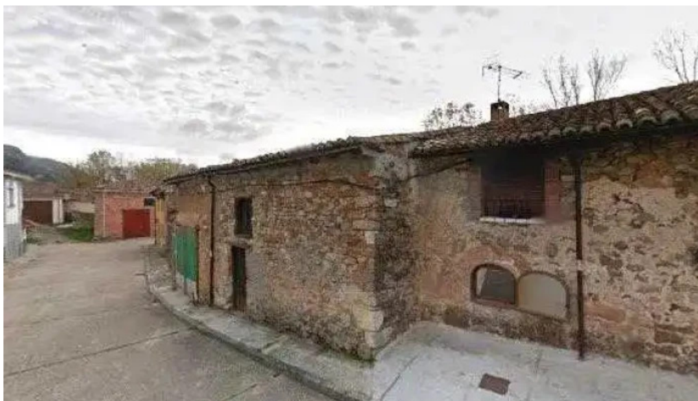
Iglesia de san martin direccion