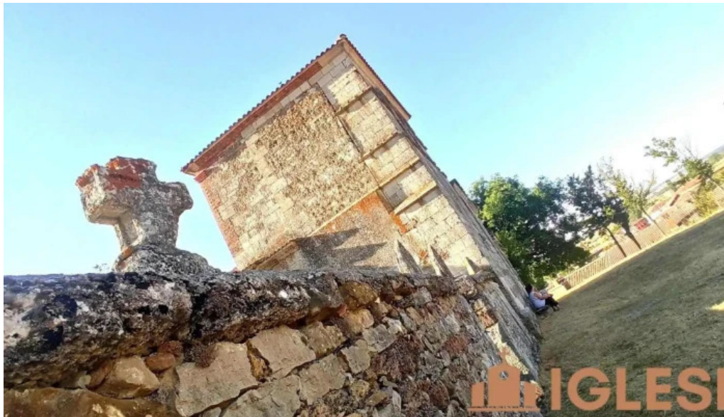
Iglesia de san martin iglesia catolica