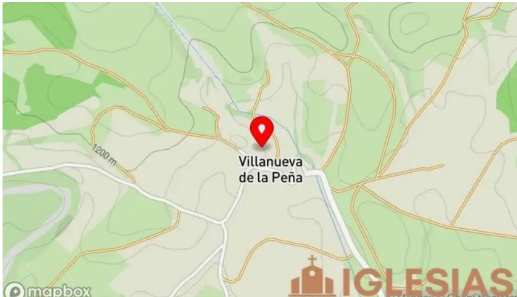
Iglesia de san martin mapa