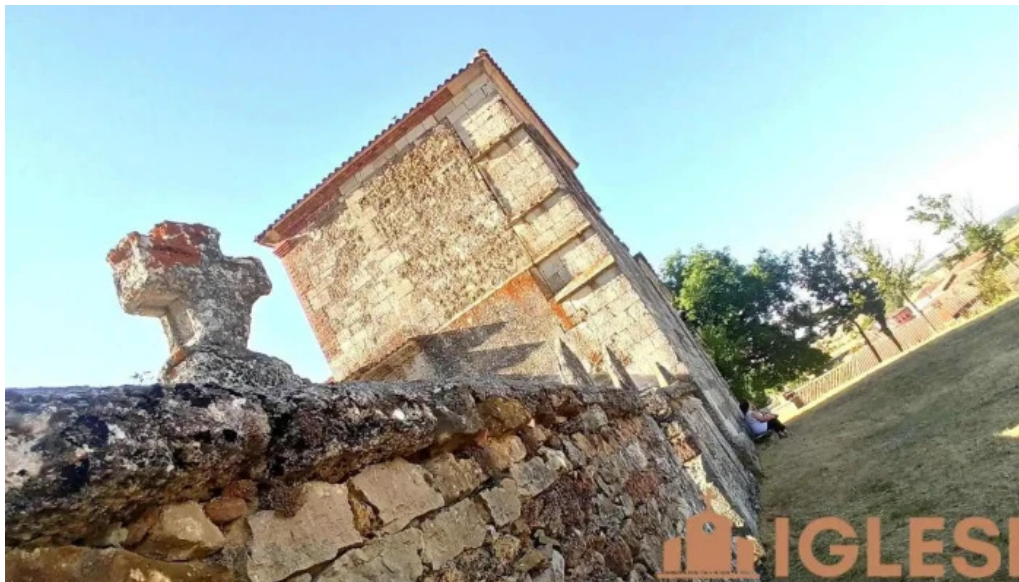
Iglesia de san martin villanueva de la pena