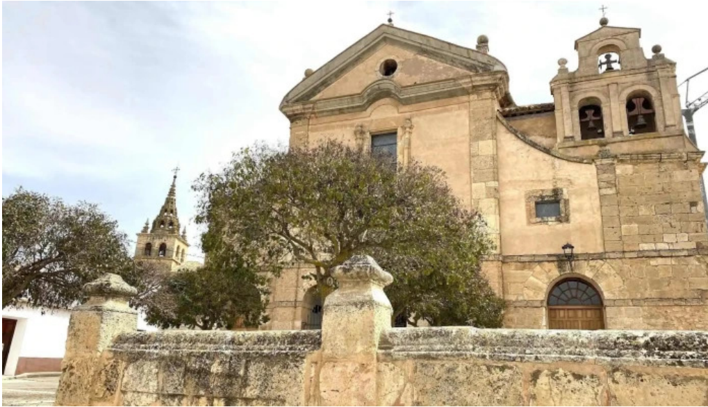
Iglesia del carmen virgen de las nieves iglesia catolica