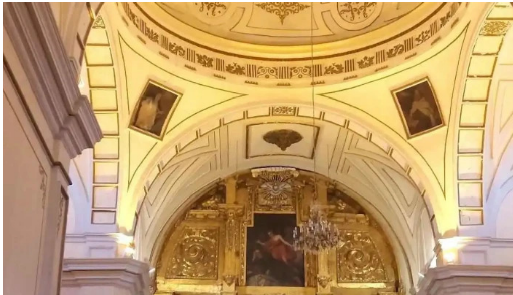
Iglesia del carmen virgen de las nieves iglesia