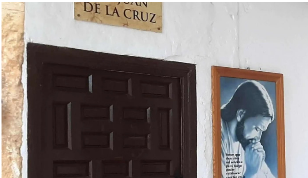
Iglesia del carmen virgen de las nieves villanueva de la jara