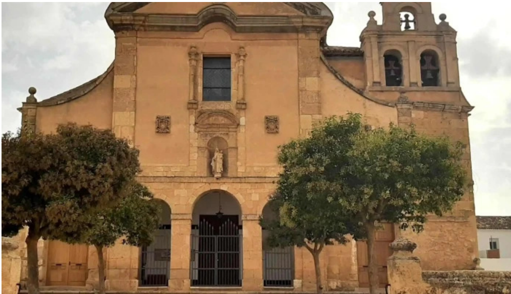
Iglesia del carmen virgen de las nieves catalogo