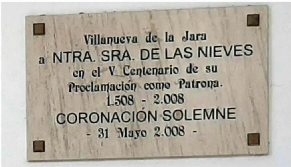
Iglesia del carmen virgen de las nieves zona