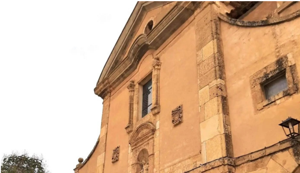
Iglesia del carmen virgen de las nieves fotos