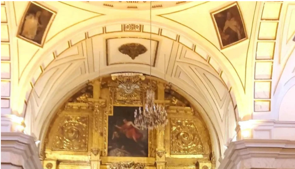
Iglesia del carmen virgen de las nieves precios