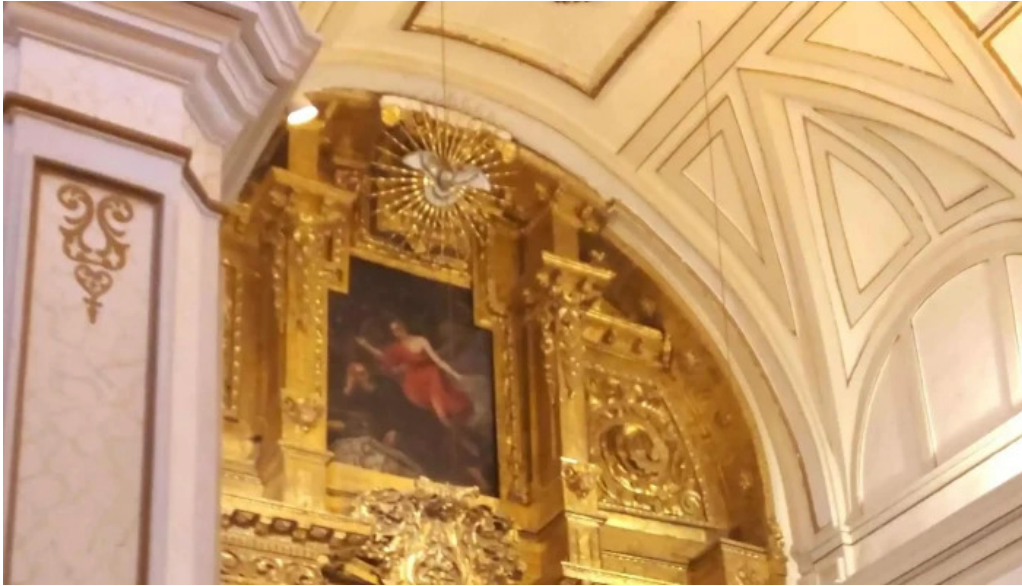
Iglesia del carmen virgen de las nieves puntaje