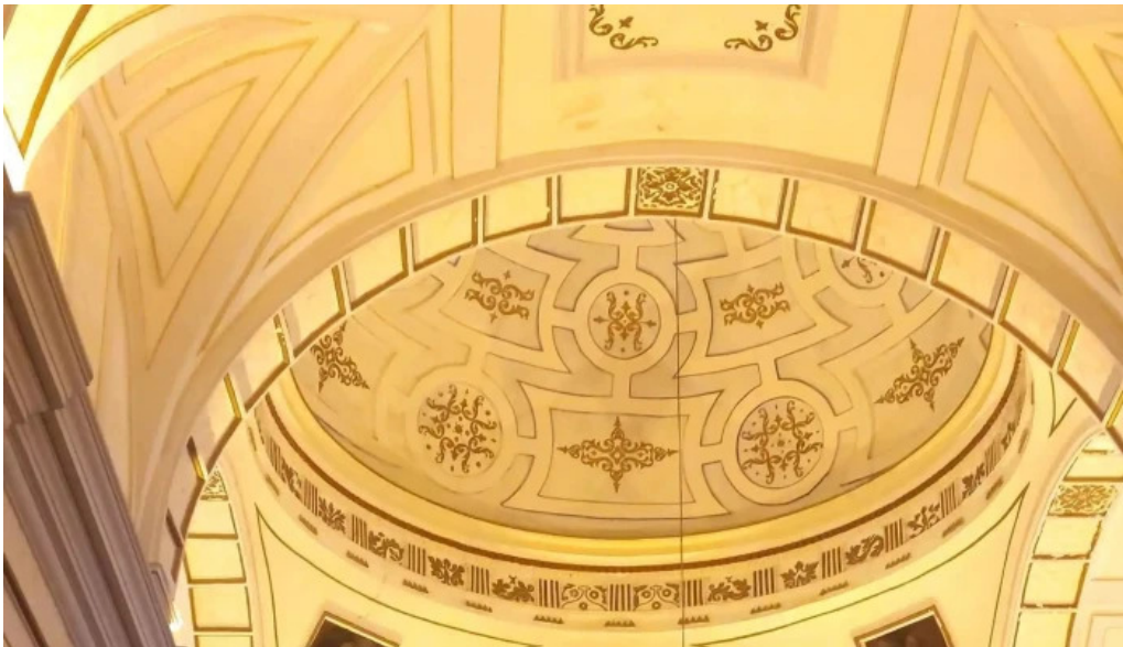
Iglesia del carmen virgen de las nieves cerca de mi