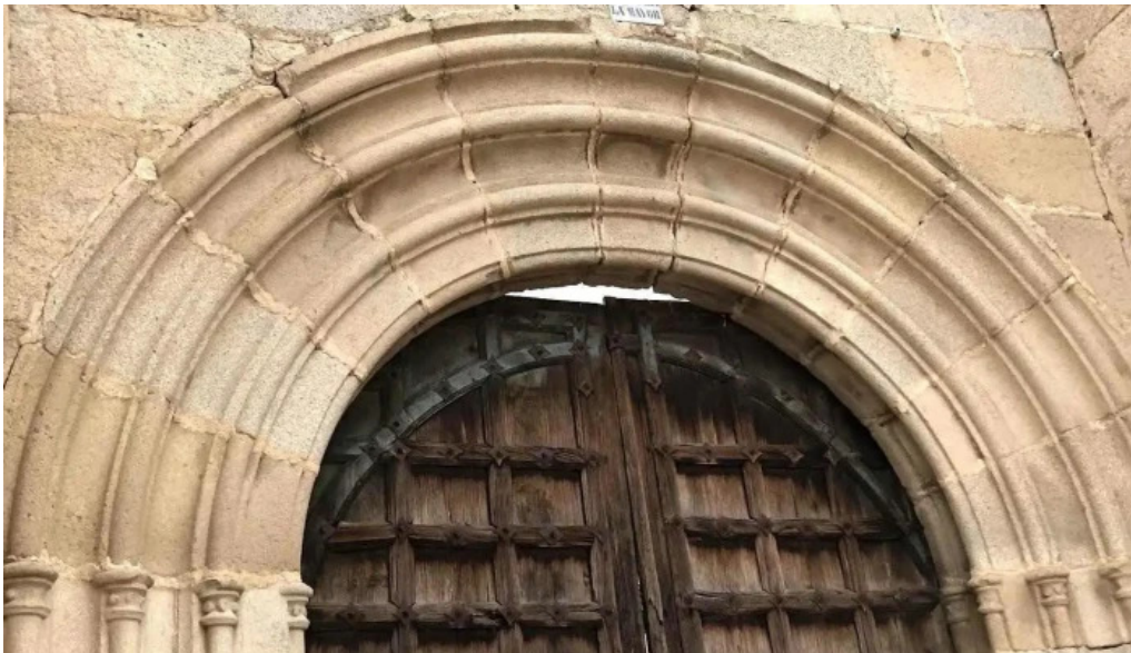
Iglesia de sta maria la mayor ruinas iglesia catolica