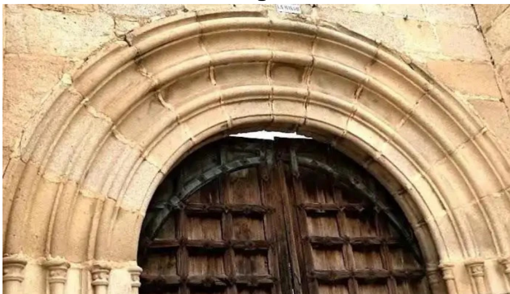
Iglesia de sta maria la mayor ruinas villanueva de gomez