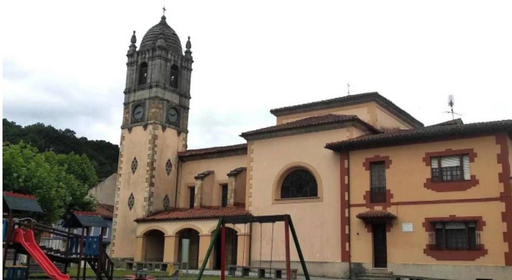
Iglesia de san pedro iglesia catolica