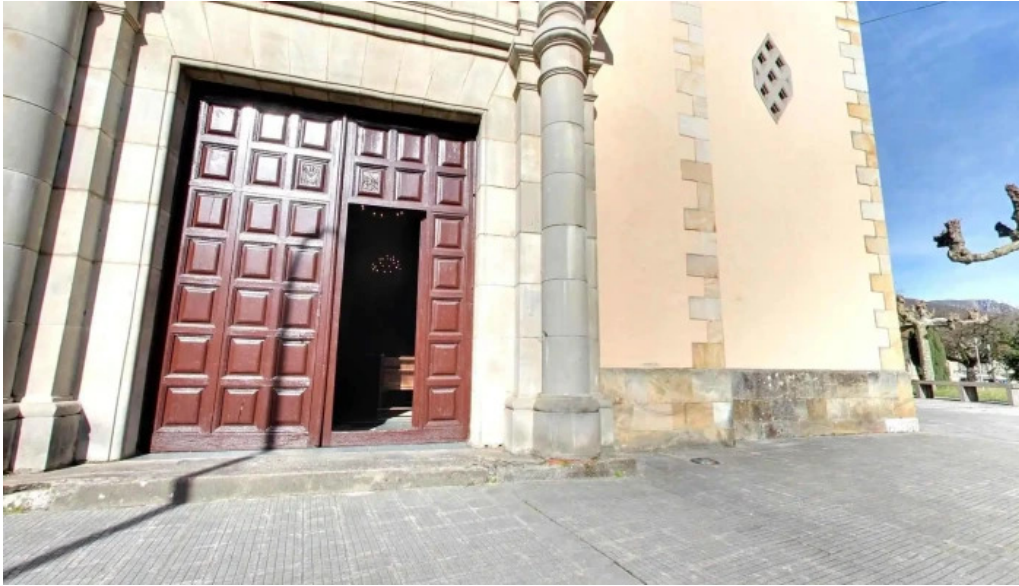
Iglesia de san pedro videos