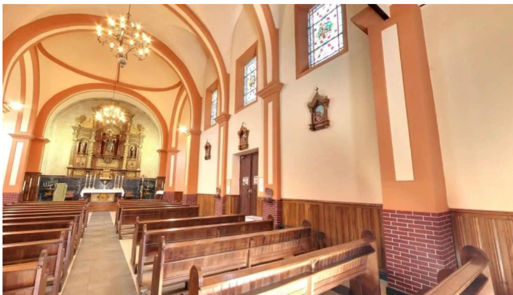
Iglesia de san pedro iglesia