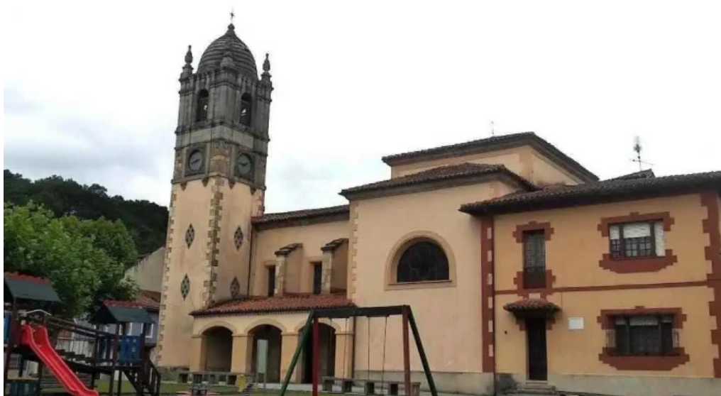
Iglesia de san pedro villamayor