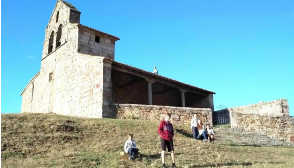
Iglesia de san pedro fotos