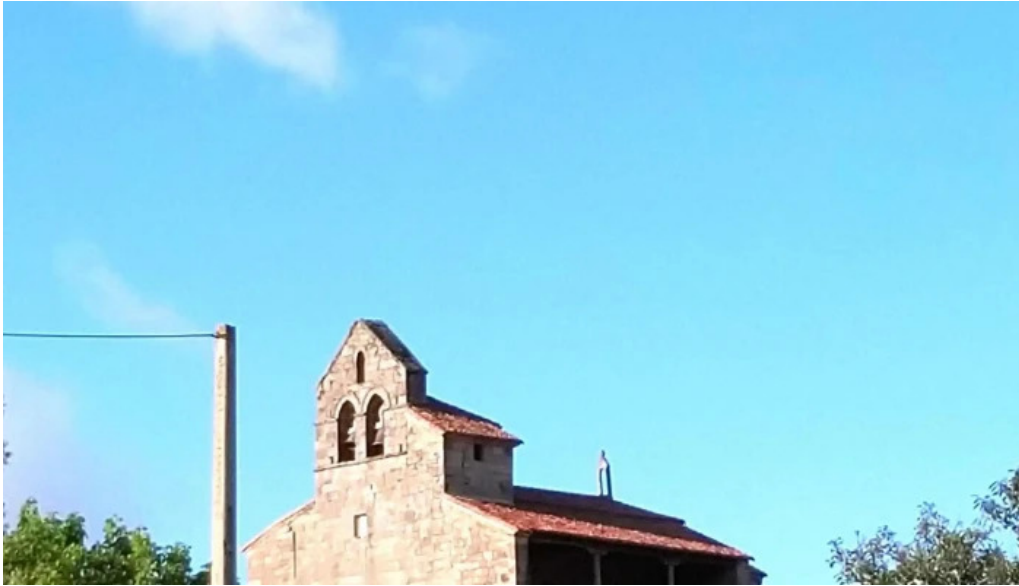
Iglesia de san pedro como llegar