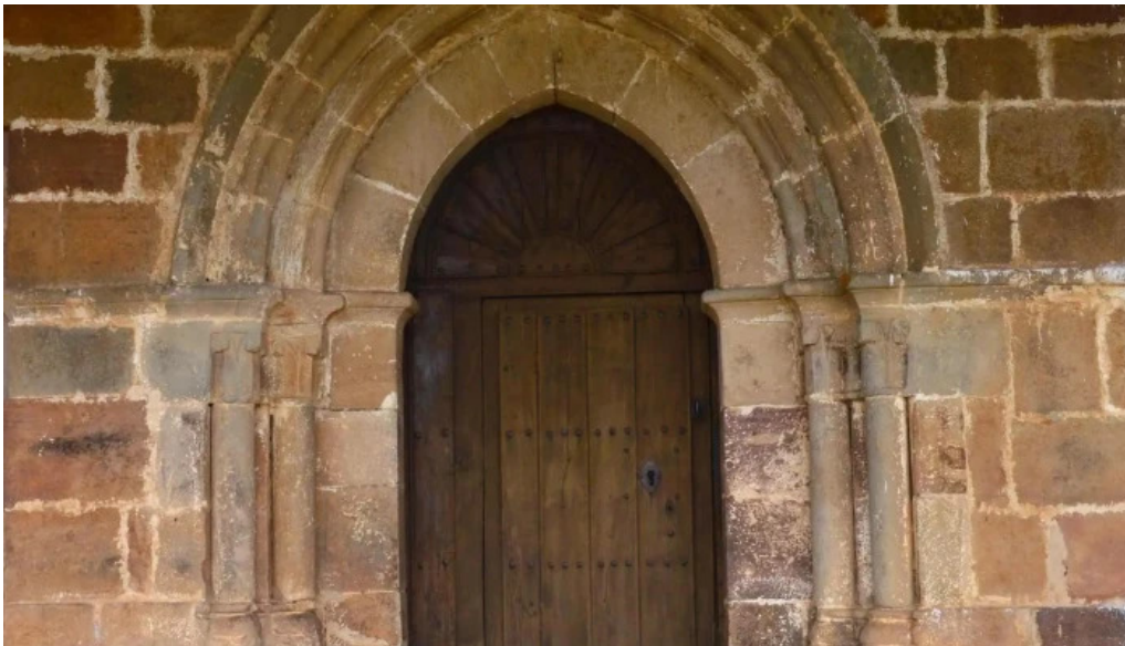
Iglesia de san pedro villabellaco