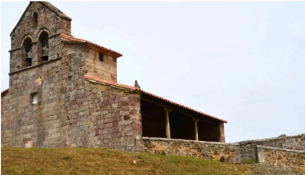
Iglesia de san pedro instagram