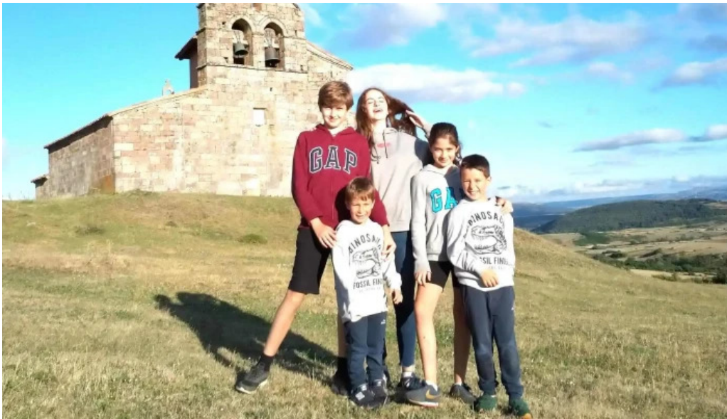
Iglesia de san pedro horario