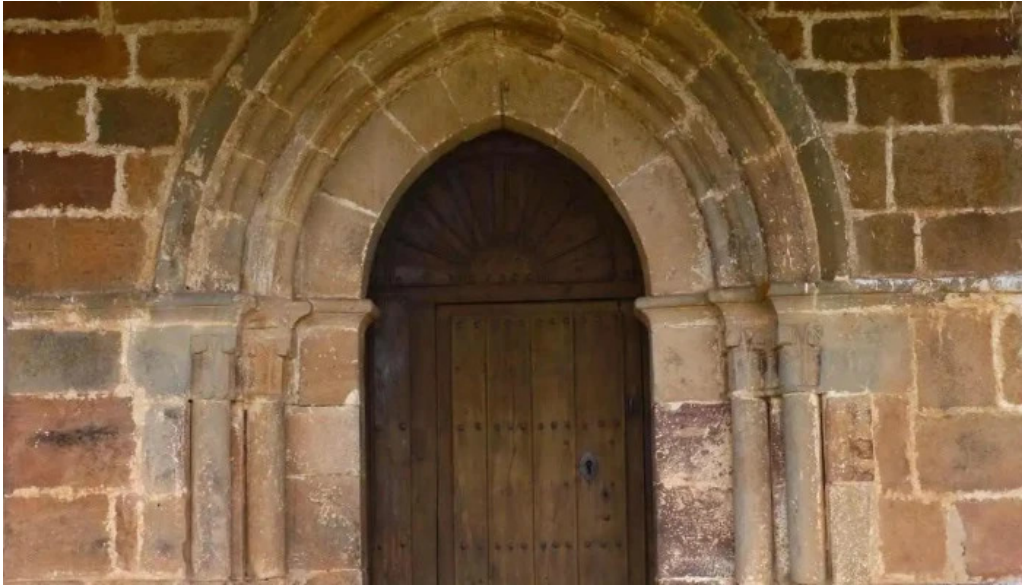
Iglesia de san pedro iglesia catolica