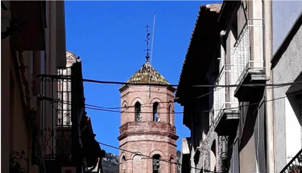
Esglesia de la nativitat de la mare de deu comentario 2