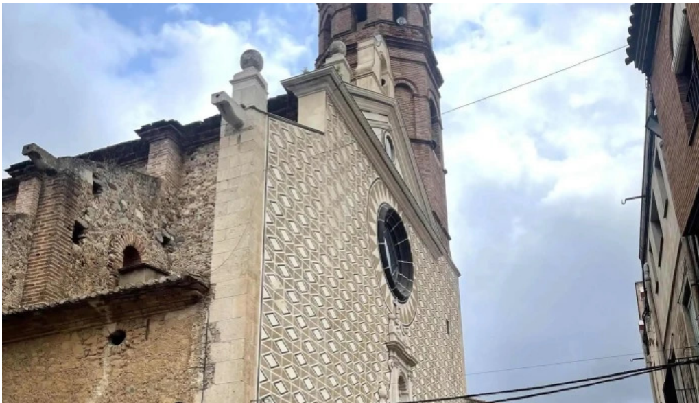
Esglesia de la nativitat de la mare de deu comentario 1