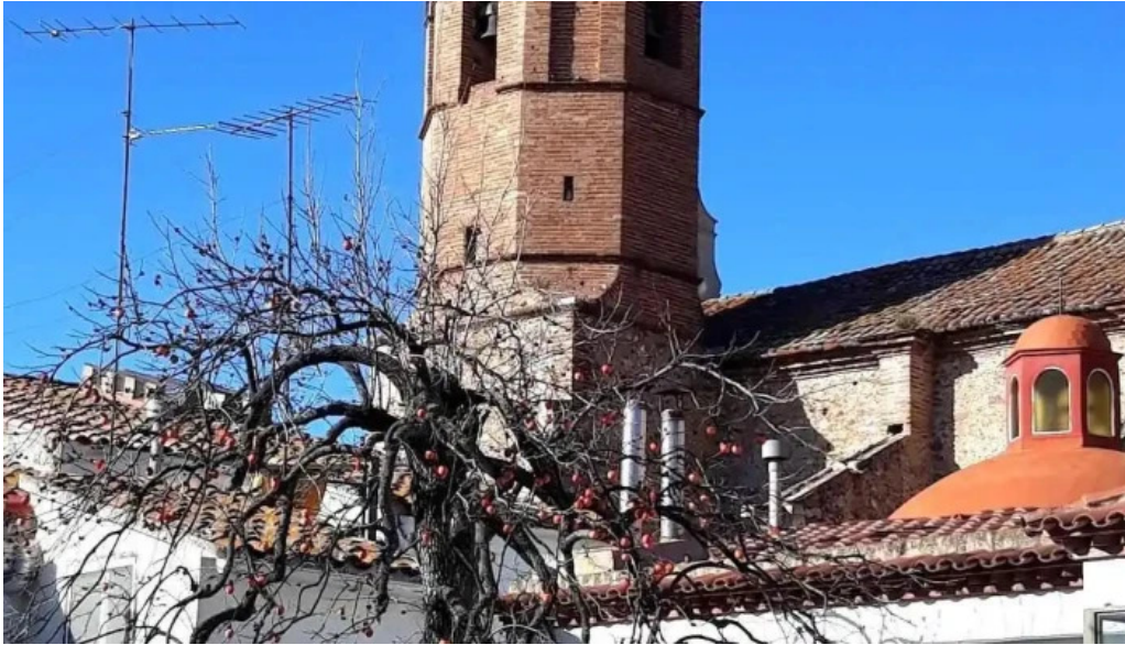
Esglesia de la nativitat de la mare de deu iglesia