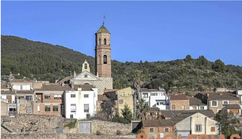
Esglesia de la nativitat de la mare de deu vilaplana