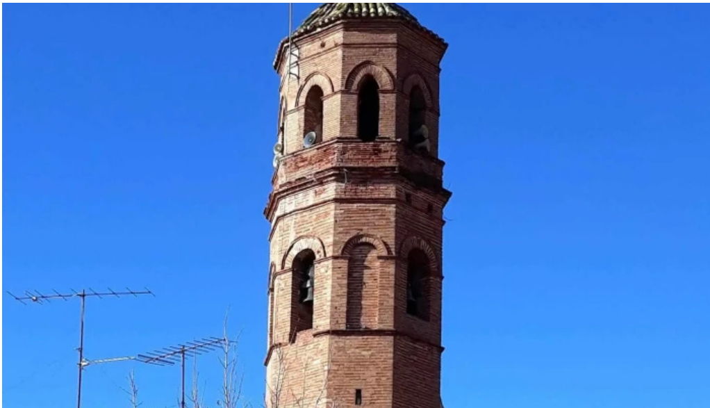
Esglesia de la nativitat de la mare de deu comentario 3