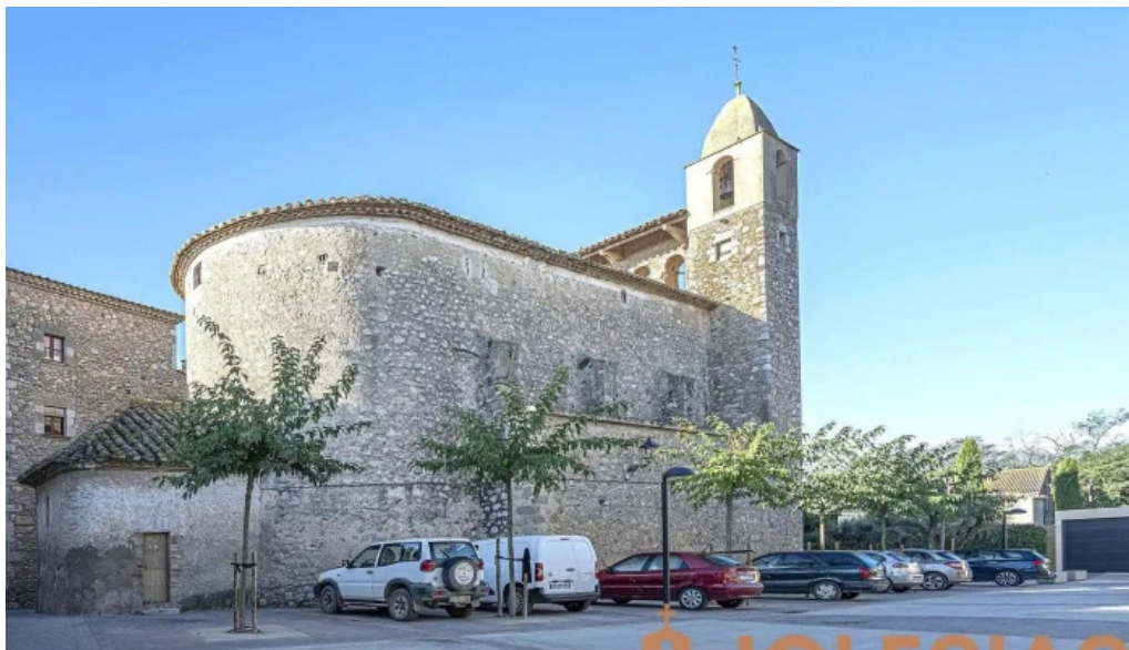
Esglesia de sant miquel iglesia