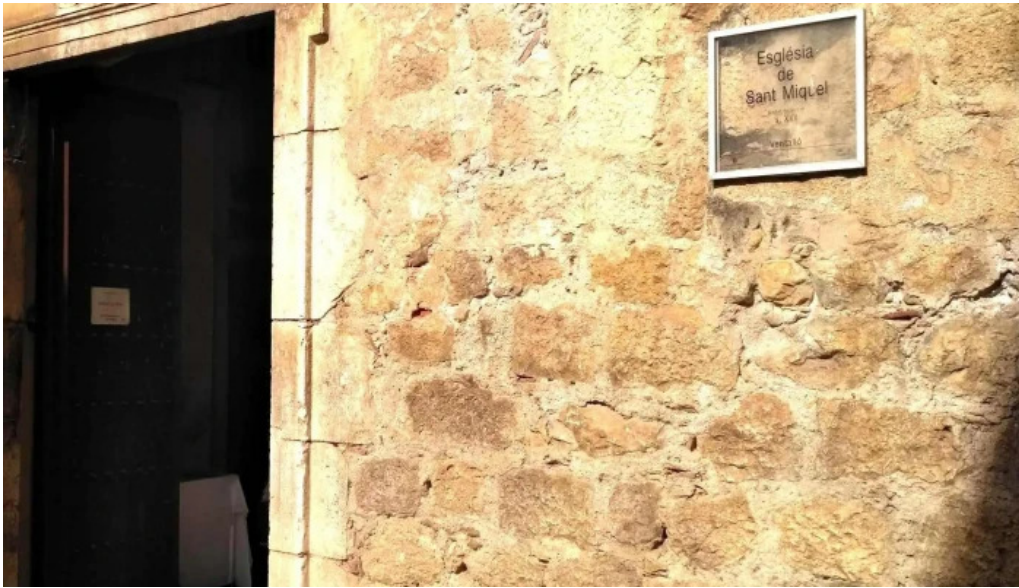
Esglesia de sant miquel puntaje