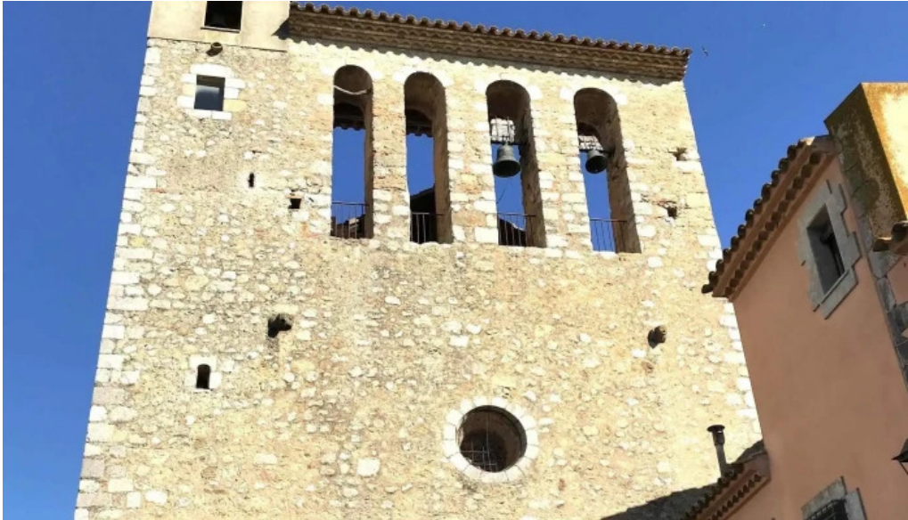
Esglesia de sant miquel iglesia catolica