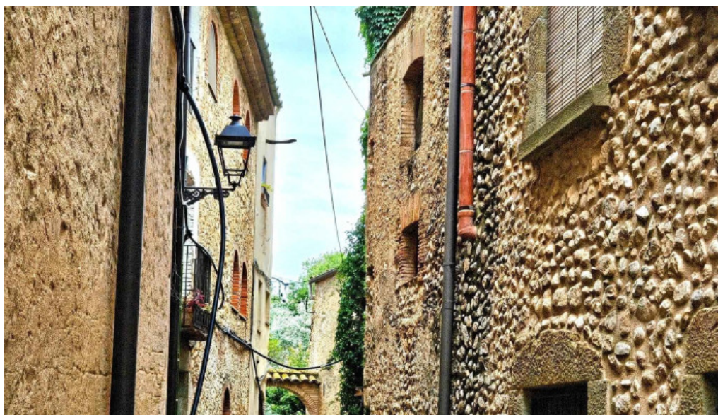
Esglesia de sant miquel donde