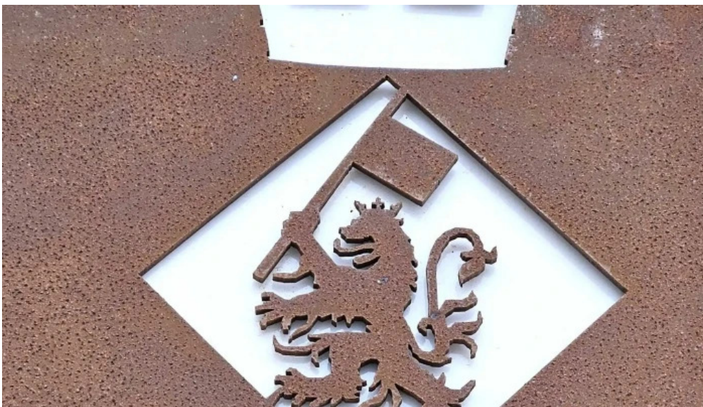
Esglesia de sant miquel precios