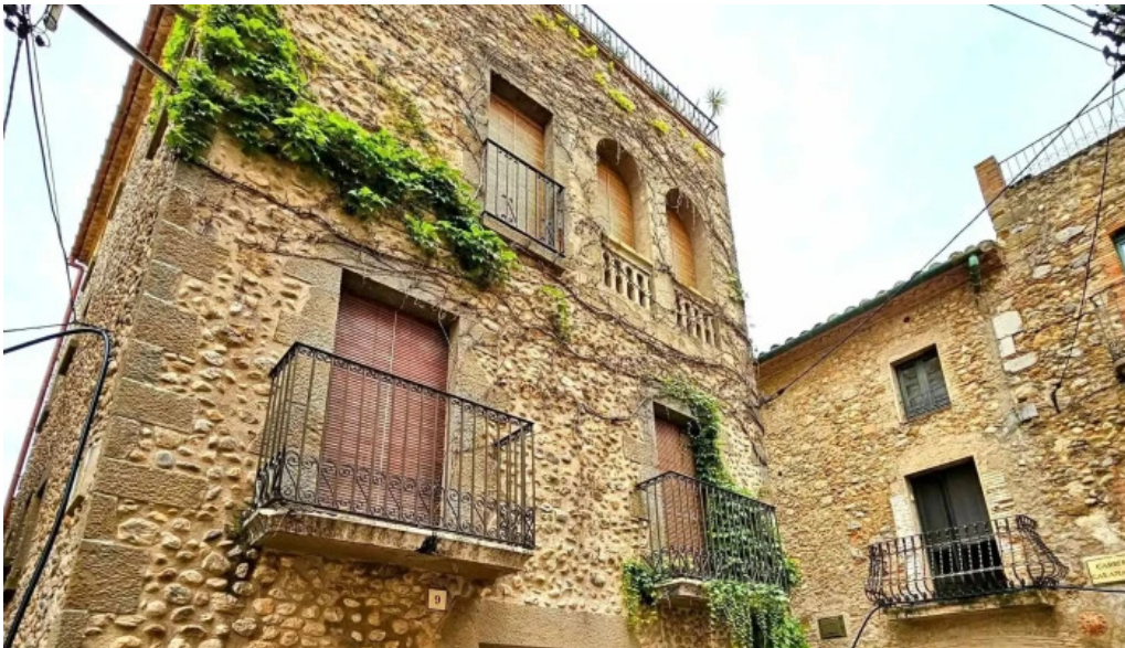
Esglesia de sant miquel fotos