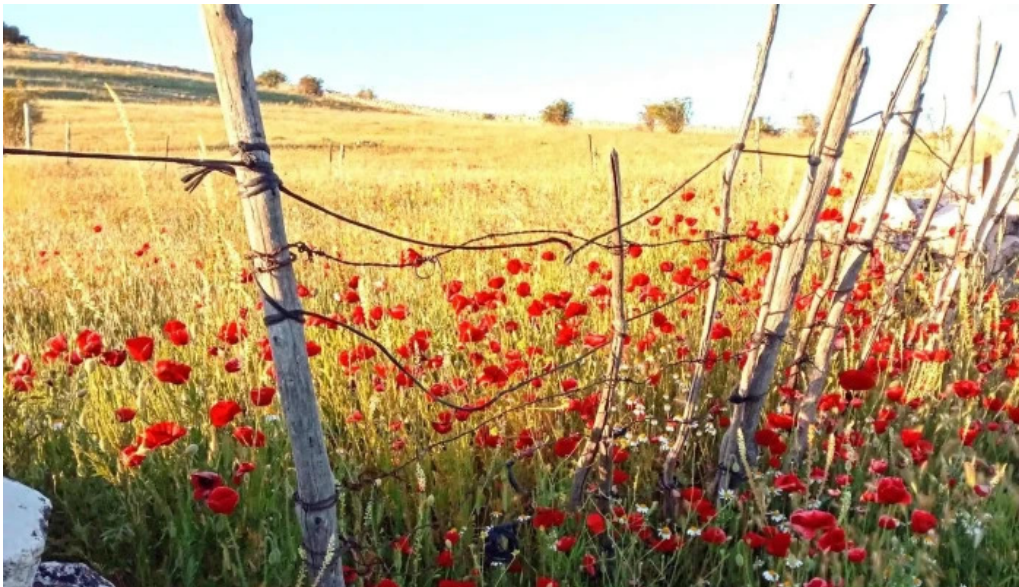
Iglesia de santo tomas de canterbury donde