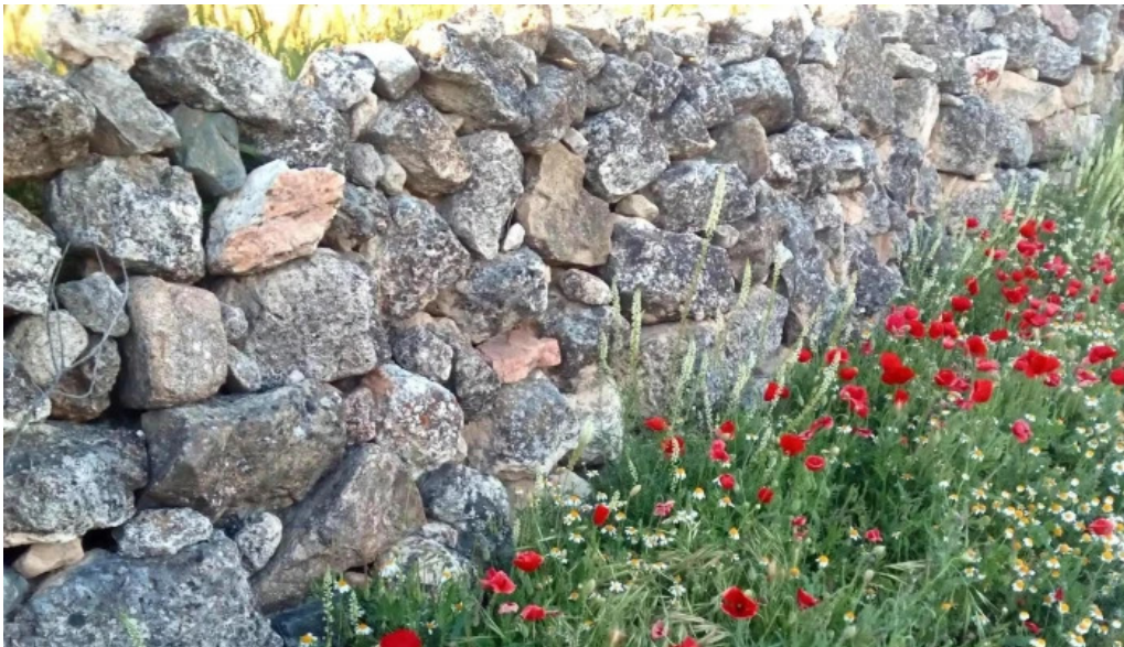
Iglesia de santo tomas de canterbury como llegar