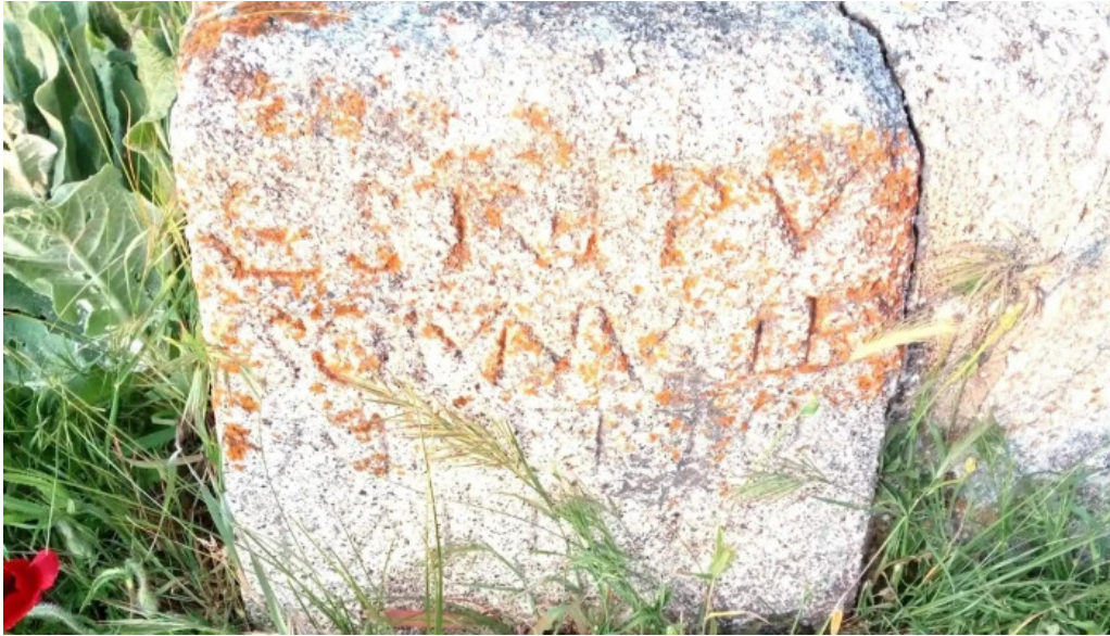
Iglesia de santo tomas de canterbury comentarios