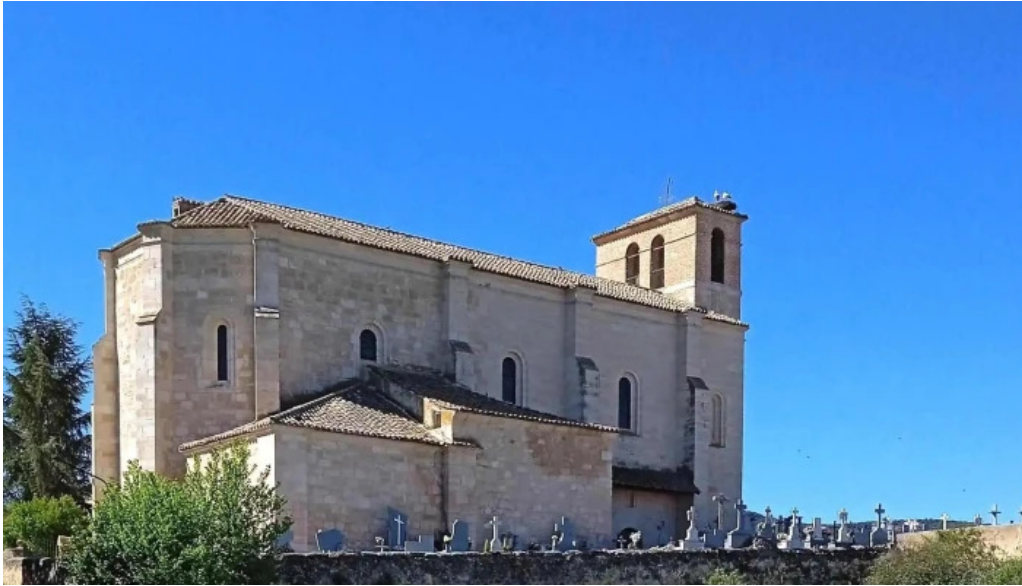
Iglesia de santo tomas de canterbury vegas de matute