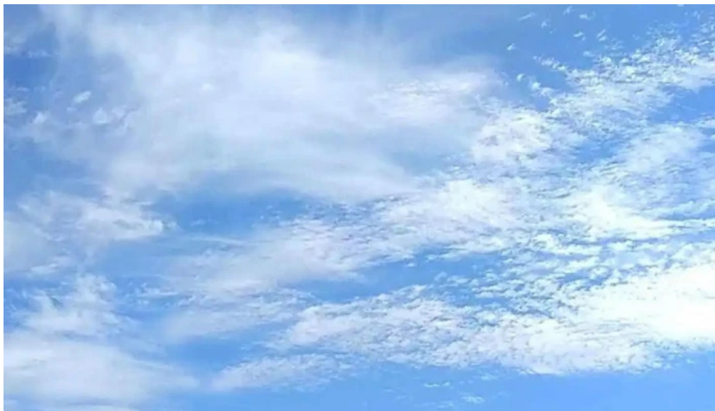
Iglesia de santo tomas de canterbury videos