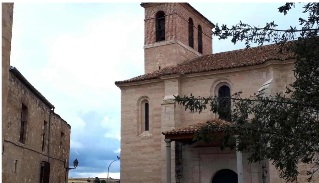
Iglesia de santo tomas de canterbury catalogo