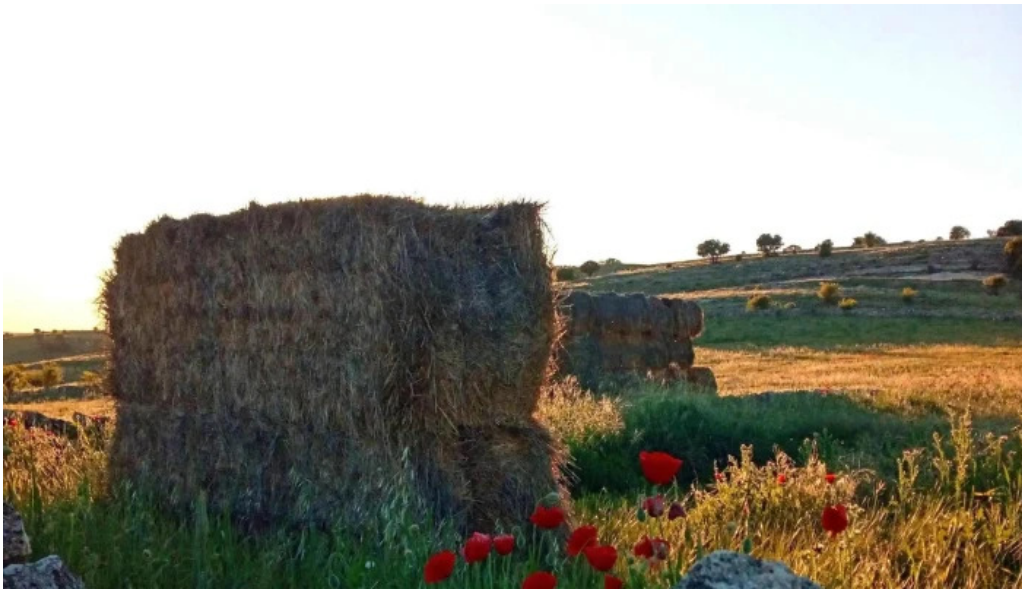
Iglesia de santo tomas de canterbury cerca de mi