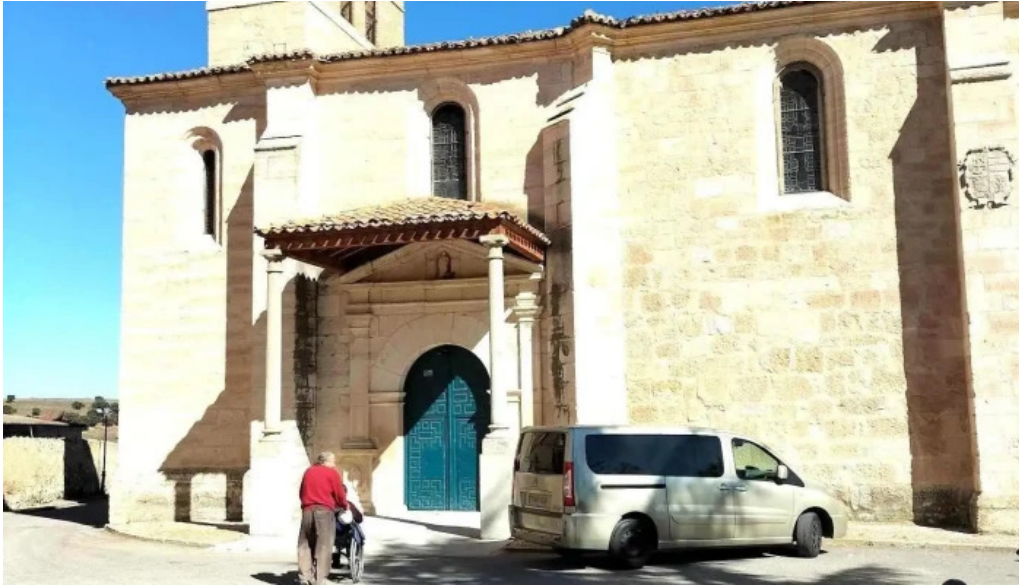
Iglesia de santo tomas de canterbury iglesia catolica