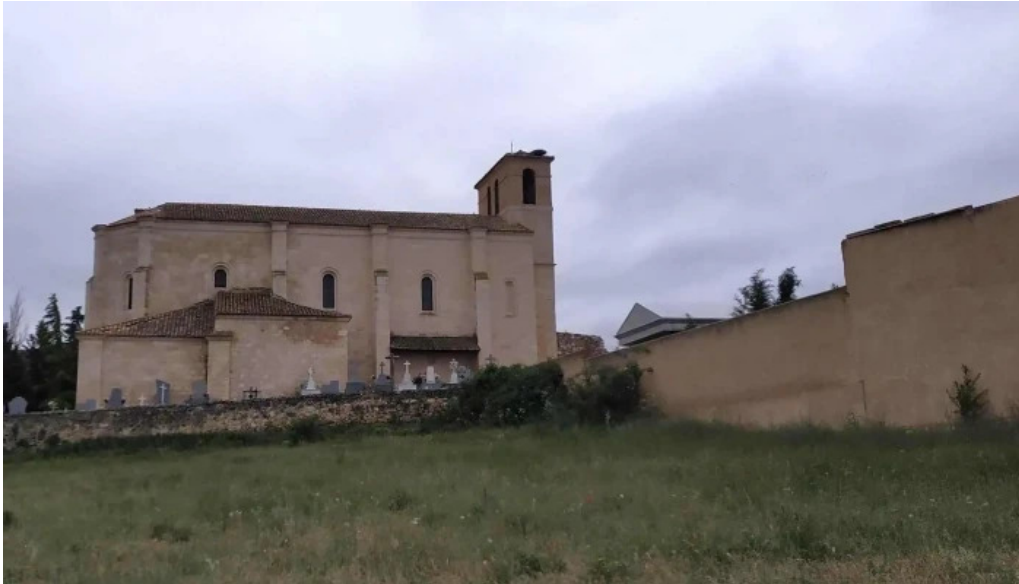
Iglesia de santo tomas de canterbury opiniones