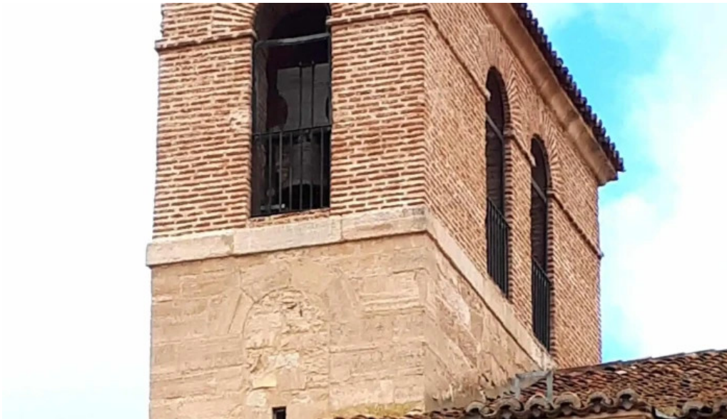
Iglesia de santo tomas de canterbury direccion