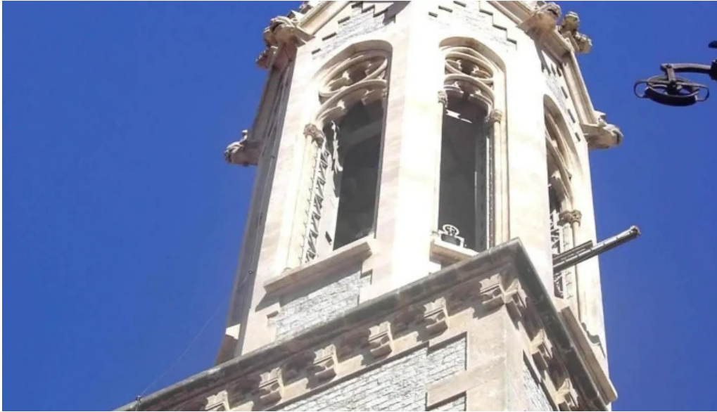
Iglesia de sant antoni abat iglesia