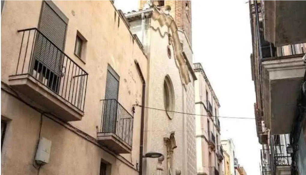
Iglesia de sant antoni abat valls