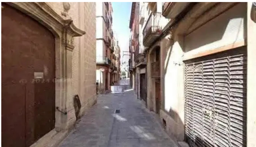
Iglesia de sant antoni abat abierto ahora