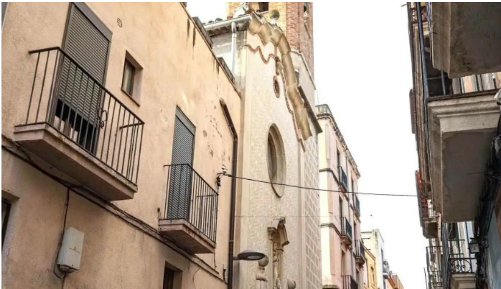
Iglesia de sant antoni abat iglesia catolica