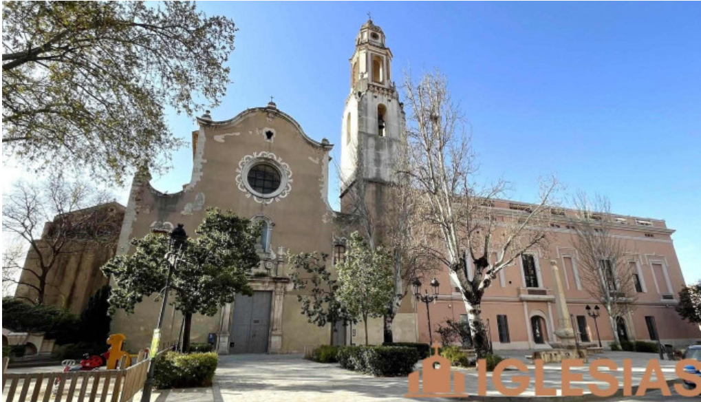
Antic convent del carne iglesia catolica