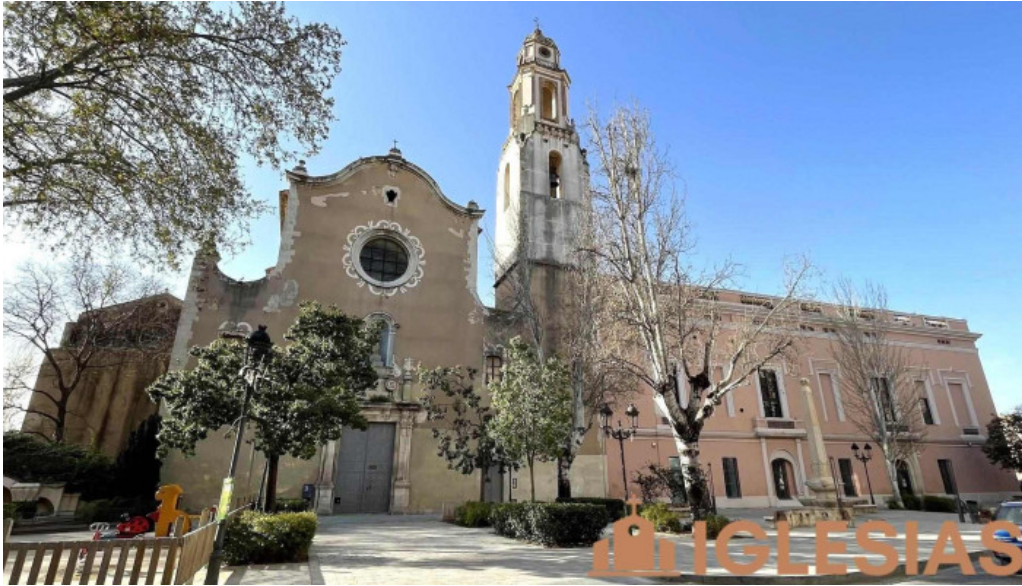
Antic convent del carne valls