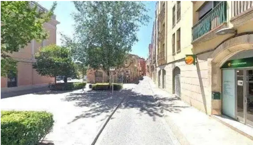
Antic convent del carne telefono