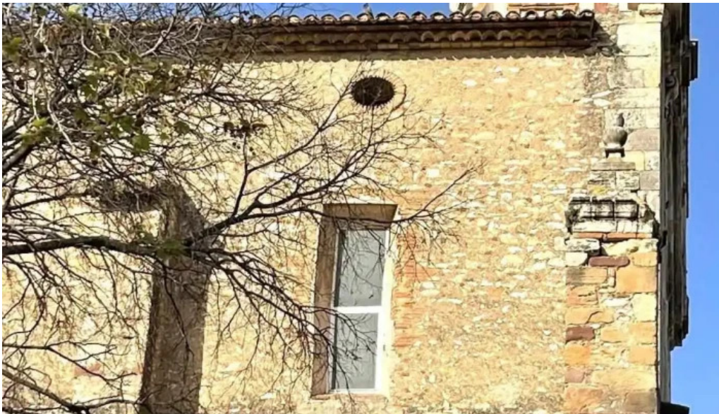
Antic convent del carne iglesia