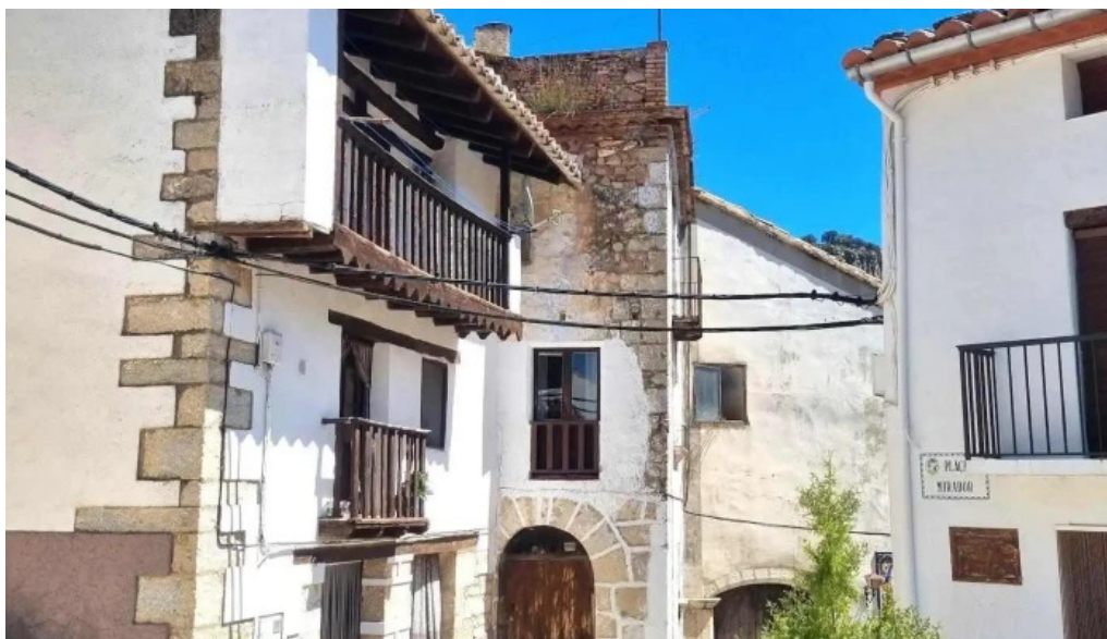
Parroquia de la asuncion de maria iglesia catolica