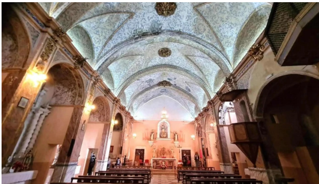
Parroquia de la asuncion de maria iglesia