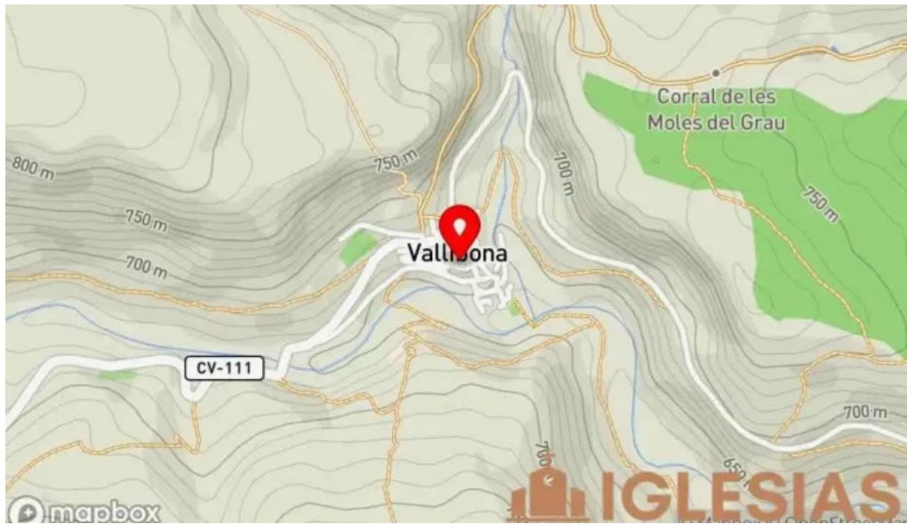
Parroquia de la asuncion de maria mapa