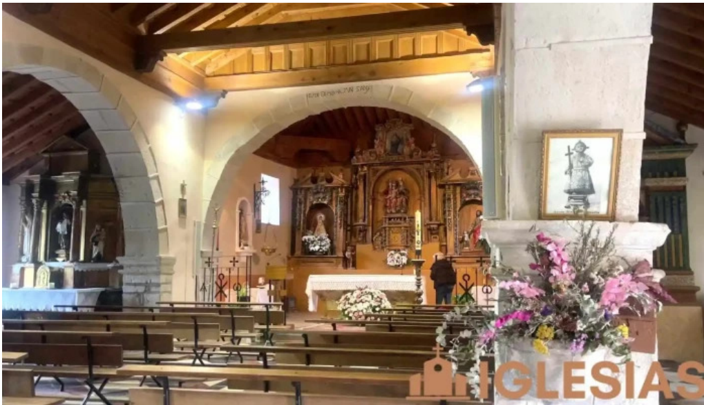
Iglesia parroquial de santa ana iglesia