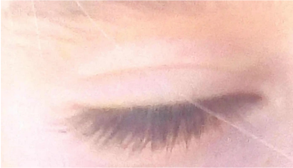
Iglesia parroquial de santa ana opiniones