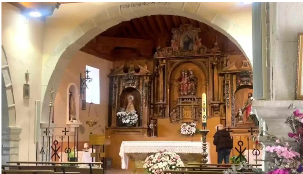
Iglesia parroquial de santa ana ubicacion