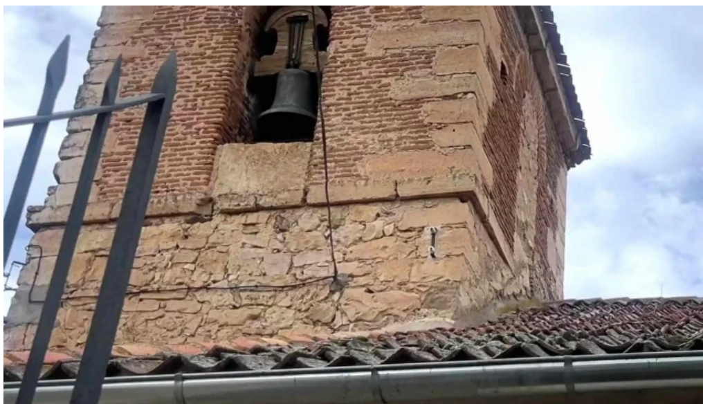
Iglesia parroquial de santa ana donde