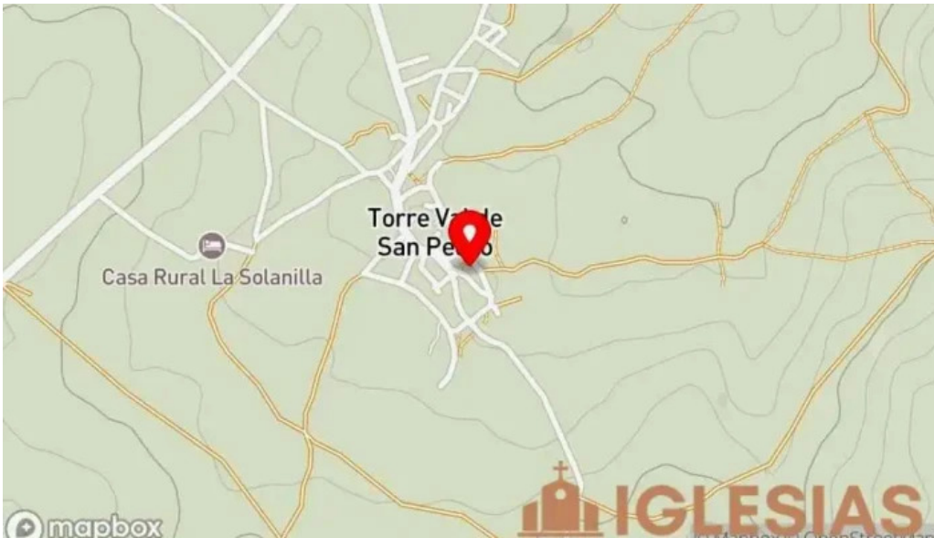
Iglesia parroquial de santa ana mapa