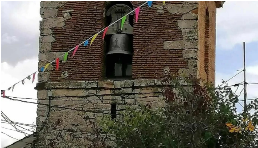
Iglesia parroquial de santa ana iglesia catolica