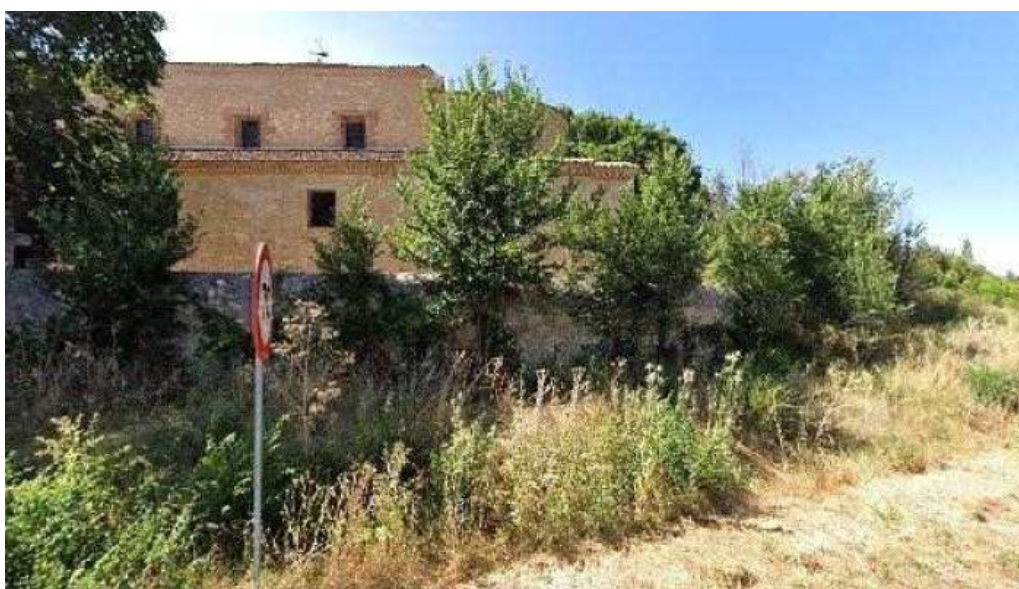
Iglesia de san pedro como llegar