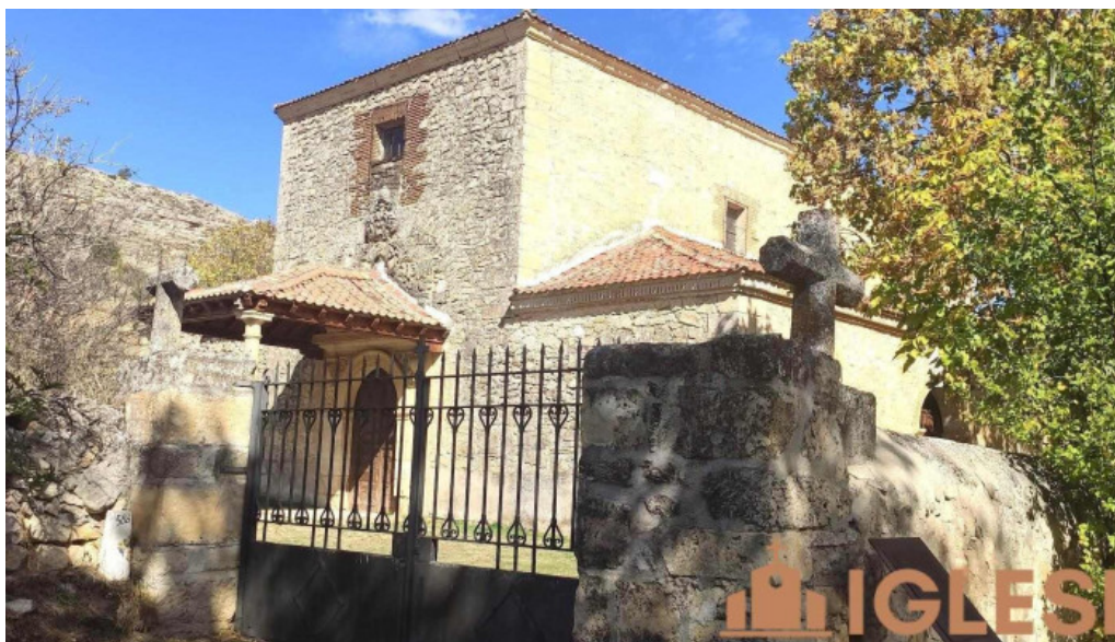
Iglesia de san pedro iglesia catolica