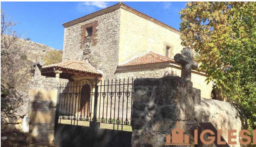
Iglesia de san pedro torre val de san pedro