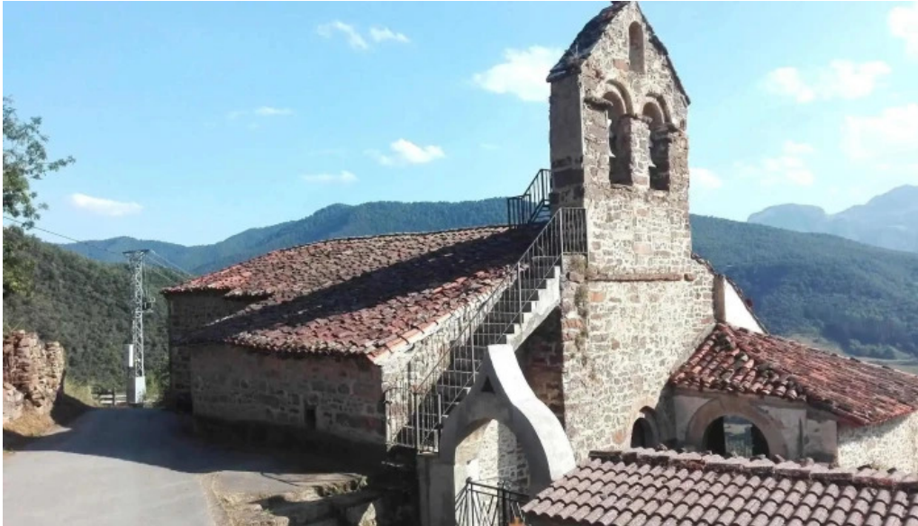
Iglesia de san martin iglesia catolica