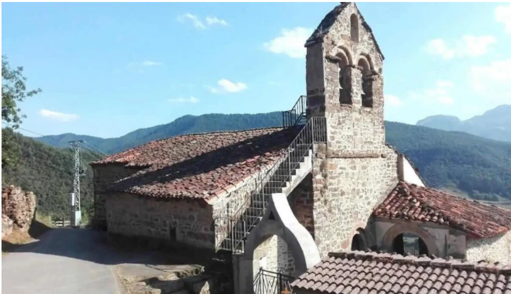
Iglesia de san martin torices